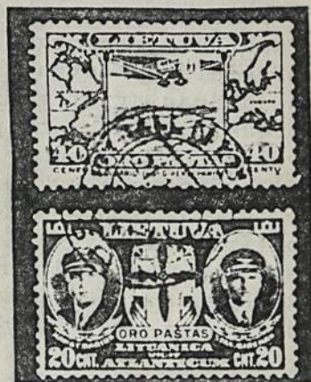
Pašto ženklai Dariui ir Girėnui pagerbti