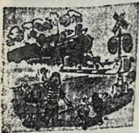
I Chicagos lietuvių tvirtovę sugūžėjo, sulėkė lietuviai iš viso pasaulio.

DRAUGAS, šeštadienis, 1983 m. liepos mėn. 2 d.