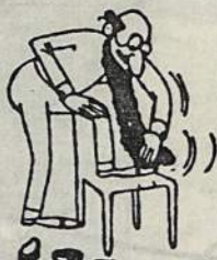
Iškilmės baigėsi banketu ir šokiais. Rūpestingai puošėsi ir vyrai,