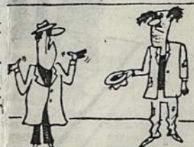
Kai Pasaulio dienos baigėsi, svečiai neturėjo ko net elgetoms numesti.