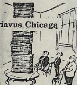
Pagal lietuvišką paprotį priėmė keletą rezoliucijų.