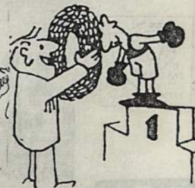
Laimėjo pirmąsias ir paskutiniąsias vietas,