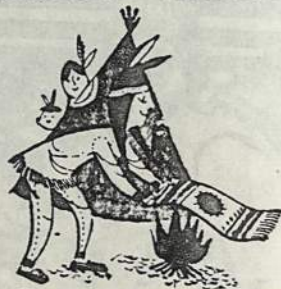
Čikariečiai jiems tiesė raudonus kilimus.