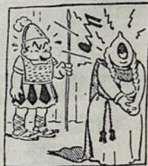
Buvo pastatyta lietuviška opera.