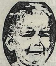
Pats save išskyrčiau iš LB, niekur nepritilpau ir gailiuosi!