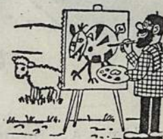
Lankėsi meno parodoje,