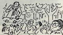
Siek tiek seimavojo,