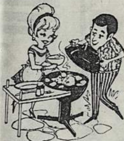
Maitino lietuvišką kugelių ir dešrą su kopūstais.