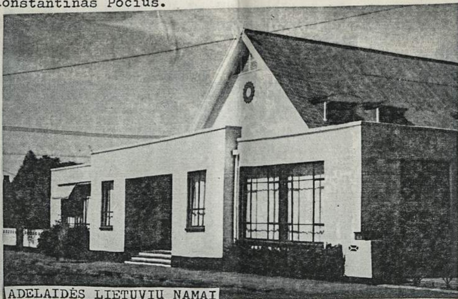
ADELAIDĖS LIETUVIŲ NAMAI