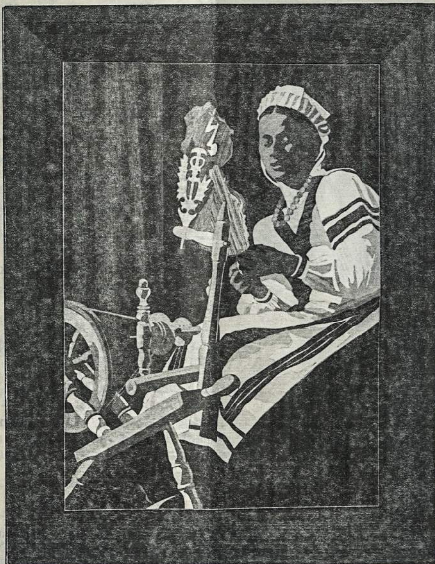
VERPĖJA - MEDŽIO INKRUSTACIJA