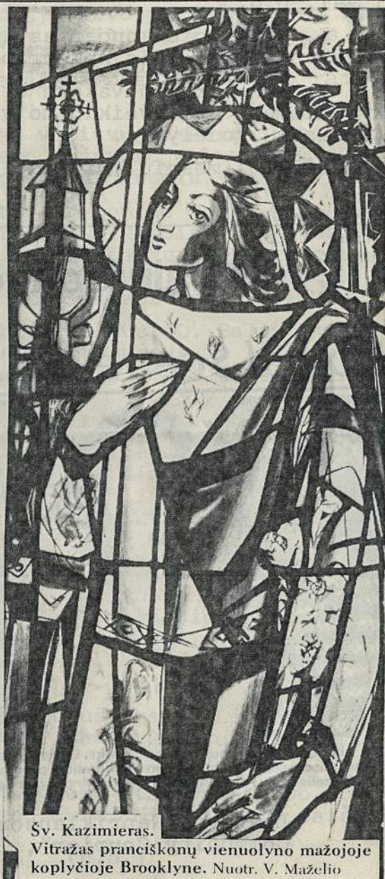
Šv. Kazimieras. Vitražas pranciškonų vienuolyno mažojoje koplyčioje Brooklyne.

Šiuo metu tų pačių rusų yra apgultas ne miestas, bet visa, nors žymiai sumažėjusi, Lietuva. Nūdien primetama ne ortodoksija, bet komunizmas ir ateizmas. Taigi galbūt labiau negu bet kada vėl reikalingas stebuklas ar stebuklai laisvei iškovoti ir tikėjimui išgelbėti. Didžioji sukaktis, kuri bus minima pavergtoje Lietuvoje ir išeivijoje, yra gera proga per savo šventąjį melsti antgamtinės pagalbos.