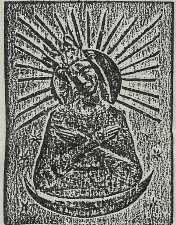
Šv. Marijos paveikslas iš Sibiro. Randasi Jėzuitų kopyčioje Čikagoje

Lietuviais esame mes gimę Lietuviais norime ir būt, Tą garbę gavome užgimę, Jai ir neturim leist pražūt.