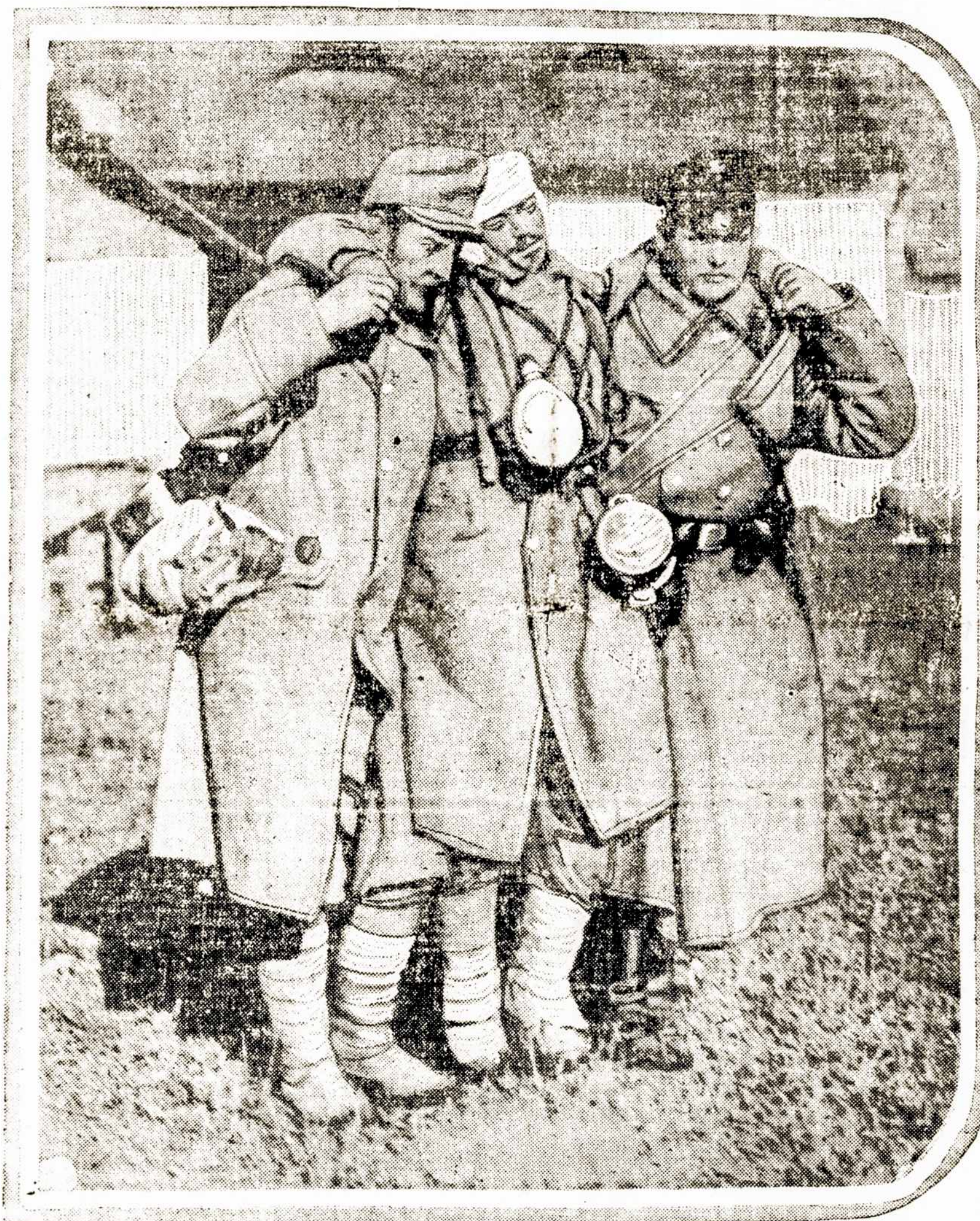
Rusų kareivis suteikia pagelbą sužeistam austrui.

Paryžius, saus. 19. — Dideli žemės drebėjimai atsi-