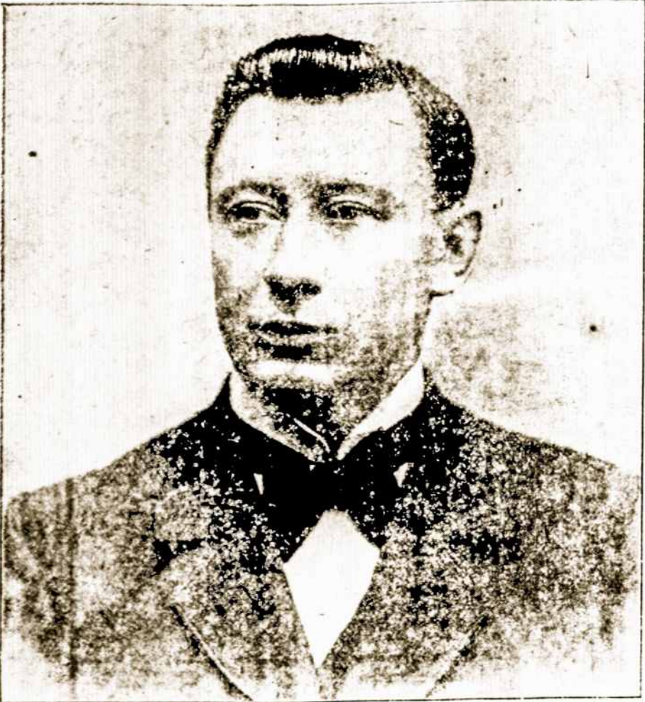
(Mikas Petrauskas, kuomet dar mokslais buvo.)

Visų žinomas kompozitorius, Mikas Petrauskas vėl sugrįžo į So. Boston ir netrukus mano ten atidaryti savo Konservatoriją. Linkime gerb. kompozitoriui kuogeriausias kloties.