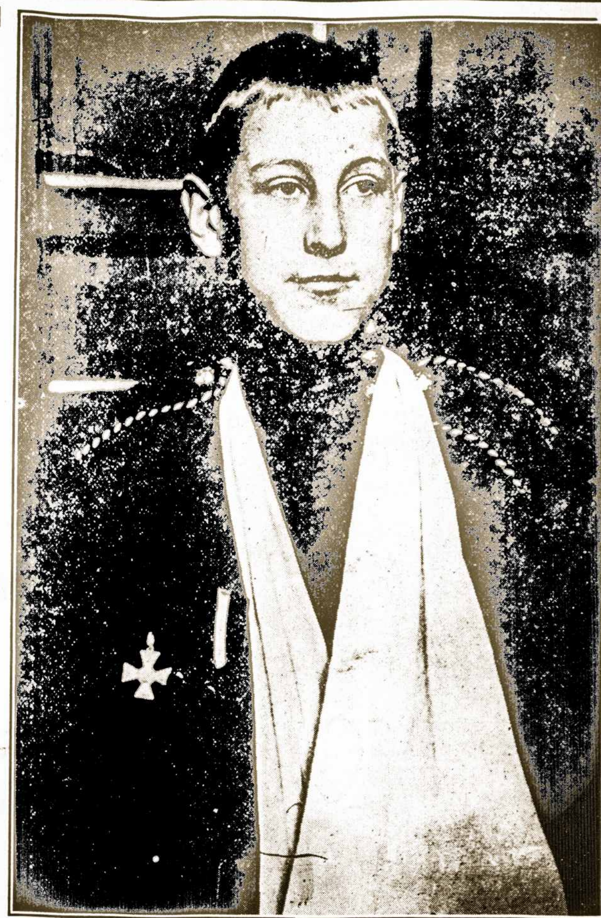
Jauniausias liuosanoris rusų kariumenėje.

Senas kareivis virš 70 m. kuris veik visą savo gyvenimą tarnavo kariumenėje. Medaliai, kurie prisegti prie jo krutinės, aiškiai parodo kad jis jau ne kartą atsižymėjo narsumu. Caras ypatingai jam davė paskutinę dekoraciją.