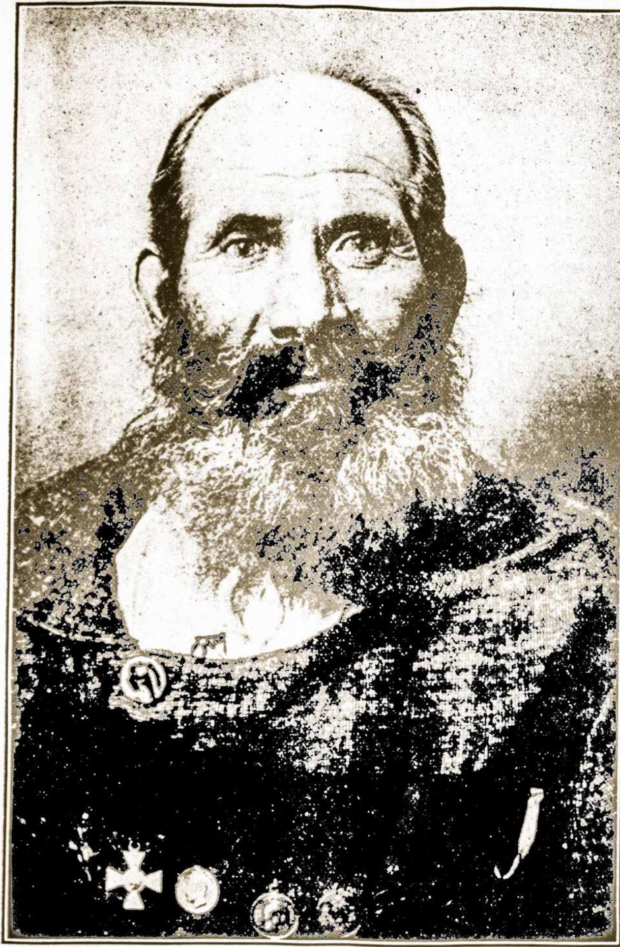
Seniausias liuosanoris rusų kariumenėje.

Moteris Korėjoj, (Azijoje, į šiaurę Kinijos) nereikalauja meilės arba pagodimo nuo savo vyrų. Jos nė