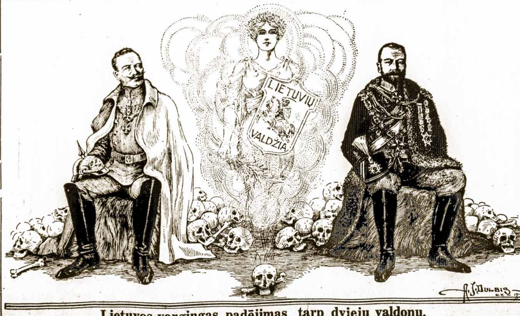
Lietuvos vargingas padėjimas tarp dviejų valdonų.

Kareivių šauksmas pagalbos yra neapsakytas, vienas šaukia morphinos, kad užmigdytų jį, kitas prašo kad jį užmuštų, negalėdamas iškęsti skausmų. Tas dejavimas ir riksmas, matymas tukstančius sužeistų, dar-gi dirbus per dienas ir naktis, galutinai žmogui visai nervus suardo.