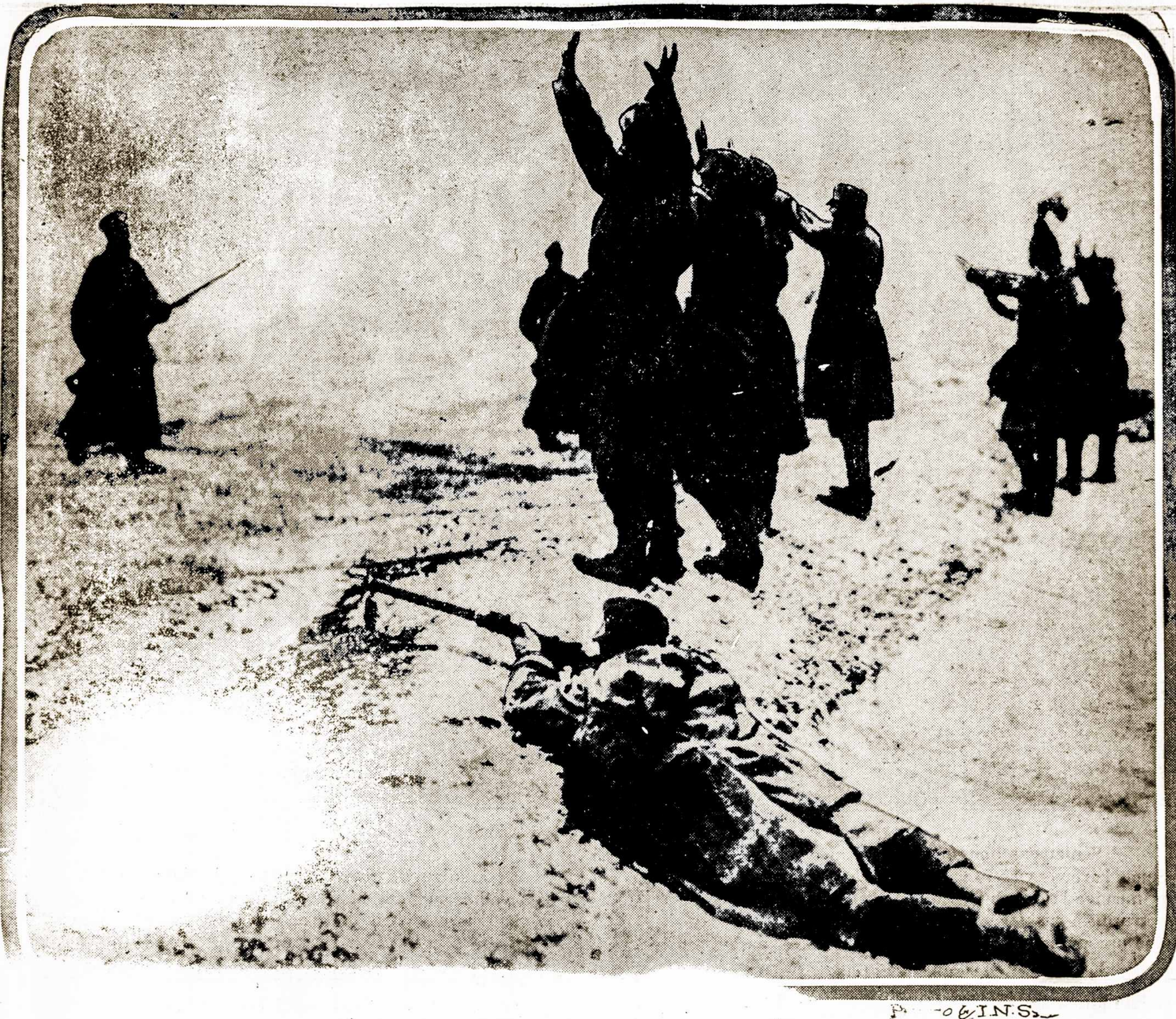
Vokiečių kareiviai pasiduoda rusams, Lenkijoje.

Sunelis. — Tėveli, šandien mokykloje aš tik vienas mokėjau atsakyti ant klausymo. Tėvelis. — Tai labai gerai suneli, o ką klausė mokytojas?