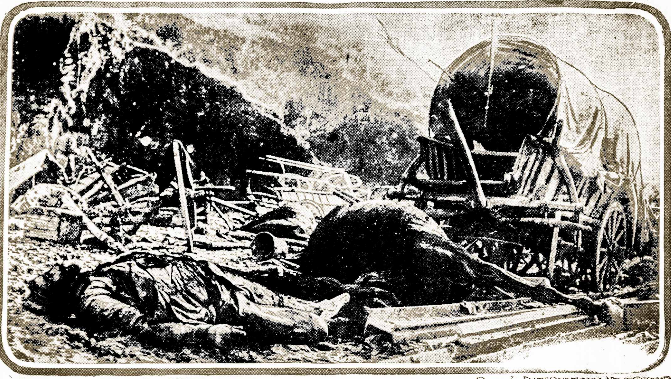
WRECKED SERBIAN SUPPLY TRAIN

O paskui, kuris, Lietuvoje užaugęs, neatsimena kovą tarp "Kumpicko" ir "Kapanicko", vidurnaktyje, prieš Velykas, ir kaip jis pyko ant rytojaus, radęs šiaudų ant žemės — kas ai-