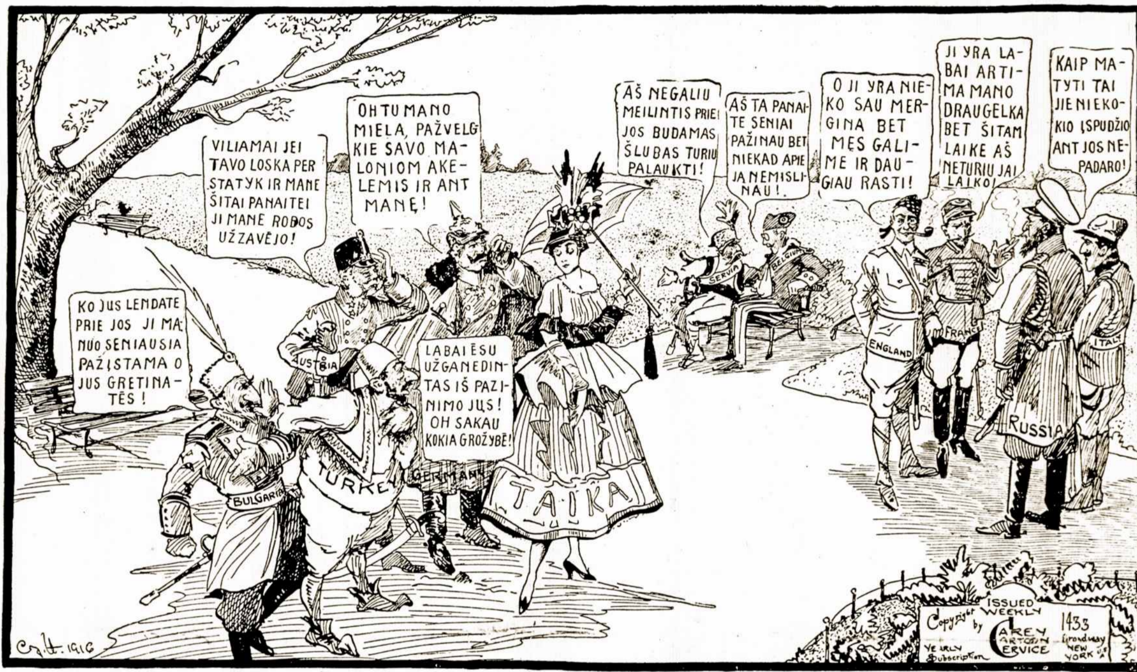
Visi jos norėtų, bet dar nelaikas.

rėje, taipgi yra "išgelbėti Europą." Reiškia, būti taip tvirti ir taip suvienyti, kad nieks nedrįstų jų atakuoti — ir taiką turėtų viešpatauti Europoje. Europa būtų šalytys tykaus darbo, kur duonos būtų užtektinai visiems. Anglija, sako kancleris, nori atimti šią duoną nuo vokiečių darbininkų, nes kare su ginklais pasibaigus, ji nori turėti buti užtikrinta, sunaikinti vokiečių prekybą.