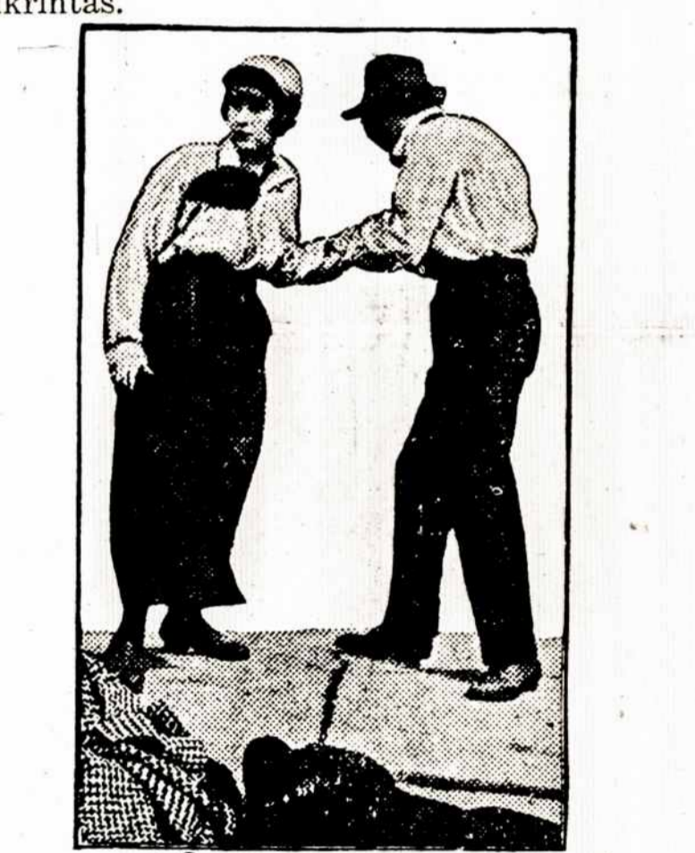
Maskuotasis, laikantis mergaitę už rankos, išbėgo iš urvo.

— Kuomet teisingas žmogus turi ką nors, kas rodos pavojinga laikytis pas save, jis prašo policijos pagelbos. Bet kuomet kriminalas ką nors pavagia, ir nori paslėpti, jis eina į savo urvą, savo paslėptą drutvietę, taip kaip Tamstos draugas, Juokiančioji Maska padarė! Ir kuo greičiau mes jį iš tos skylės išsimisime, tuo geriau bus!