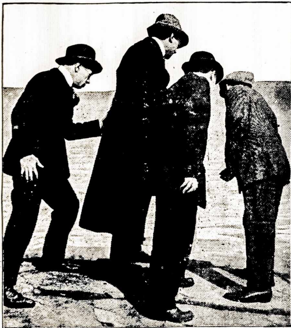
Legar ir jo sėbrai, tēmija Maskuotąjį ir Margory bepuolant.

PARSIDUODA NAMAI 3 familijų naujas namas, šiluma, gasai, maudyklės, landrės, beržo padangės, randos $612 į metus. aplinkui lietuviai; prie parko. Prekę prienamama. JOHN BUKOKAS, Real Estate ir Fire Insurance 121/2 Millbury st. Tel. Cedar 2934