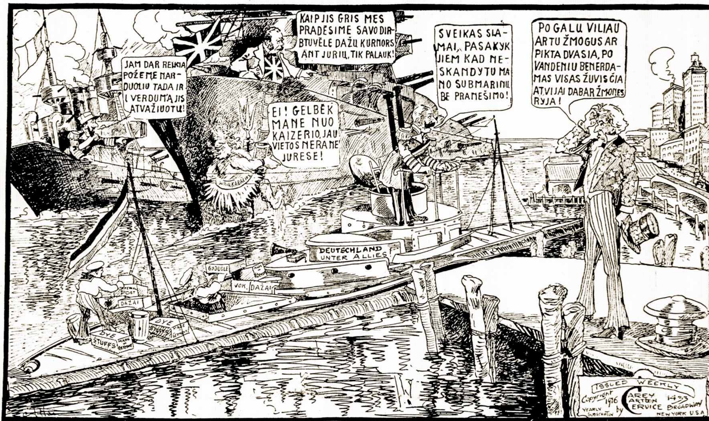
Tik-ka iš vandens išlindęs.

kiečiai progresavo ties drutiviečių Souville ir Laufee, netoli Verduno ir paėmė 2145 francuzų nelaisvėn. Mušis aplink Verduną vis taip pat smarkiai tolyn tęsiasi, ypač kas link artilerijos šaudymosi.