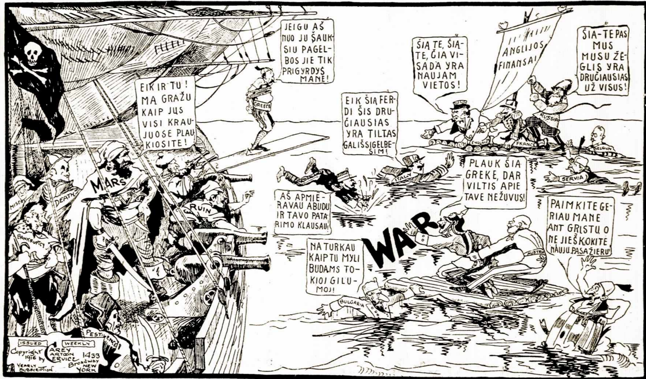
Sokant nuo lentos.

Daugiausia gandų pareina kas link tos nelaimingos Graikijos stovio. Buvo pranešta, kad Graikijos karalius jau atsakęs nuo sosto, kad Graikija jau stoja karėn ant sąjungiečių pusės ir t.t. Teisybė yra, kad Bulgarija dar vis neutralė, bet irgi rodos teisybė, kad ji gali bile valanda stoti karėn. Visoj šiaurinėje dalyje Graikijos eina rodos pasekminga revoliucija prieš valdžią, užtai kad atidavė tiek žemės bulgarams. Sąjungiečiai paėmė į savo rankas telegrafus ir pačią Graikijos, išvijo iš ten vokiečių agentus špiegus, pagriebė teutonų laivus Graikijos priepilaukoje ir a-