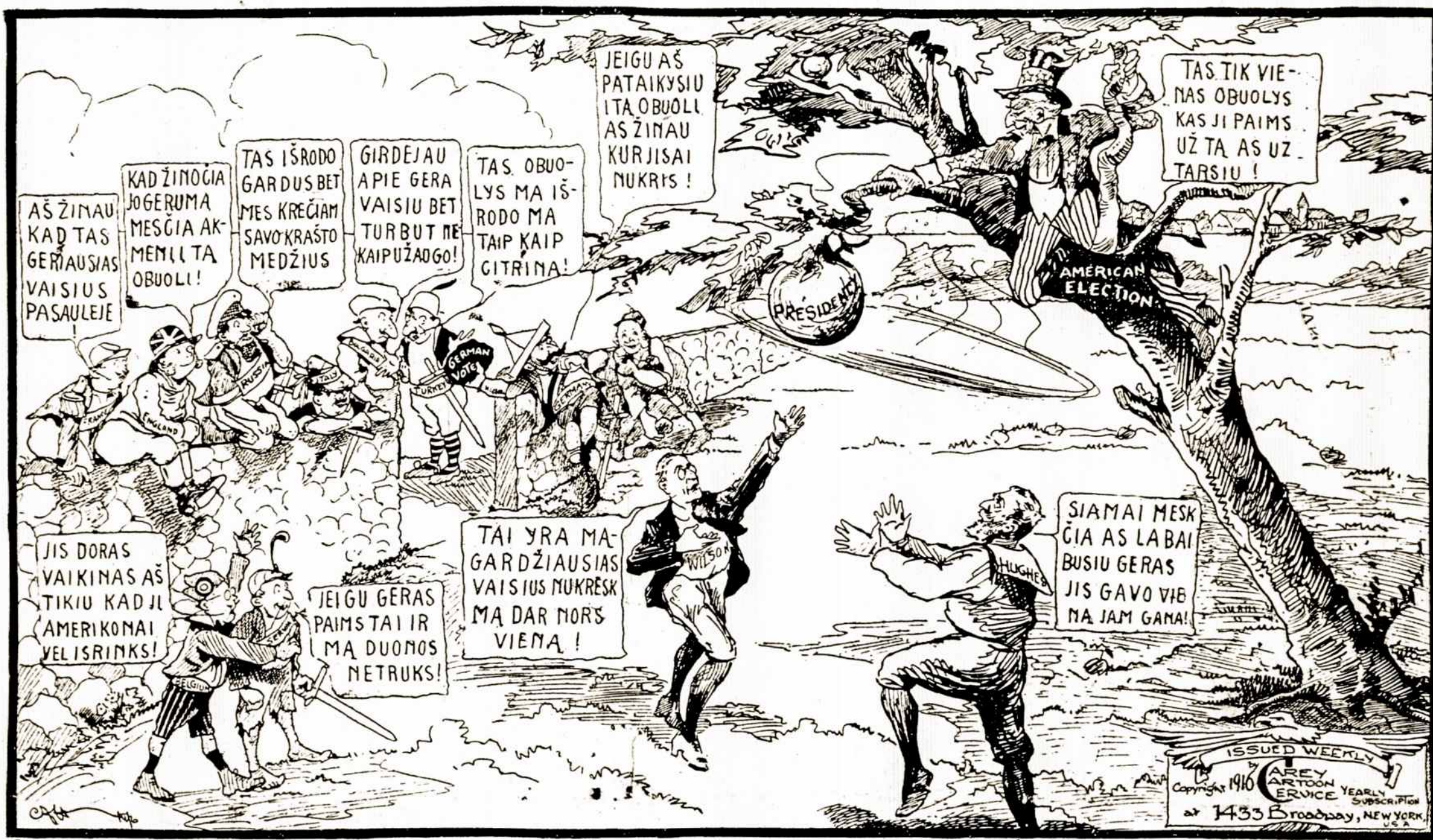
Dėdės Samo sode.

Transylvanijos Alpuose, vos 60 mylių į šiaurę Bucharesto, vokiečių pulkai at-