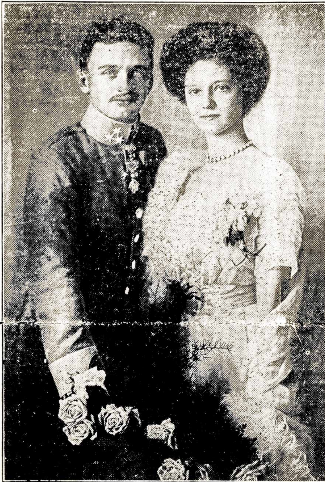
Dabartinis Austrijos imperatorius, Karolis I, su savo pačia.

Vienna, lapkr. 22 — Naujas Austrijos imperatorius, Karl Franz Jozef, pradėjo valdyti šį vakarą. Dar nenu-tarta kada jis bus apkarunavotas, bet beabėjo kad iš priežasties karės, apkarunavimas atsibus be jokių pasilinksminimų bei parodų. Vienos ir visos