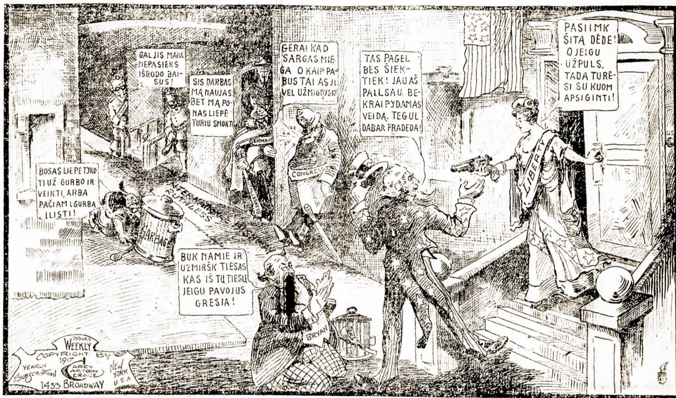
Išrengimas į kelionę.

Londonas, kovo — Kovojuojimas ant vakarinio fronto pastarom keliom dienom, ne labai svarbus buvo. Daugiausia tik artilerijos šaudymas bei lengvi susirėmimai. Anglai vienok truputį pirmyn nužengė Ancre upės klonyje.