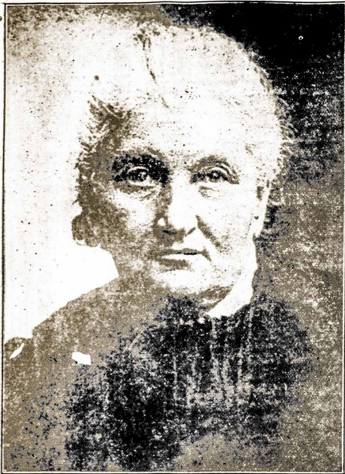
Ponia Katrina Breškovskaja, "Revolucijos Močiutė."

Tik keleta dienų po paėmimo valdžios į savo rankas, Rusijos Duma paskelbė, kad visi politikos nelaisviai, visi laisvės mylėtojai, kurie buvo taip ilgai kankinami bauriausiuose kalėjimuose arba ištremti Sibire, bus susykpaluiosuoti. Tarpe šių nukentėjusių laisvės idėjos platinotojų ypačiai buvo pažymėta Ponia Katrina Breškovskaja, žinoma kaip "Revolucijos Močiutė". Teisdarystės ministeris Koldarinskis net pranešė, kad ši garbinga senutė bus pargabenta iš Sibiro ir priimta su didžiausia pagarba, su iškilėmis. Net specialė komisija buvo pasiųsta Sibiran į pasitikti. Visoje pasaulėje, žmonės mylinti laisvę, gerbianti didvyriškumą, nuolat išgirdę šią žinią. Nes "Revolucijos Močiutės" vardas ir istorija yra plačiai žinoma netik Europoje, bet Amerikoje ir visur kur tik randasi apšviestų, mastančių žmonių.