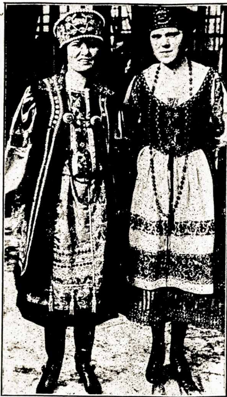
Merginos apsirendžiusios puikiais rusų tautiškais rubais

Šveicarijoj svetimtaučiam daleista gyventi tik gavus daleidimą nuo valdžios.