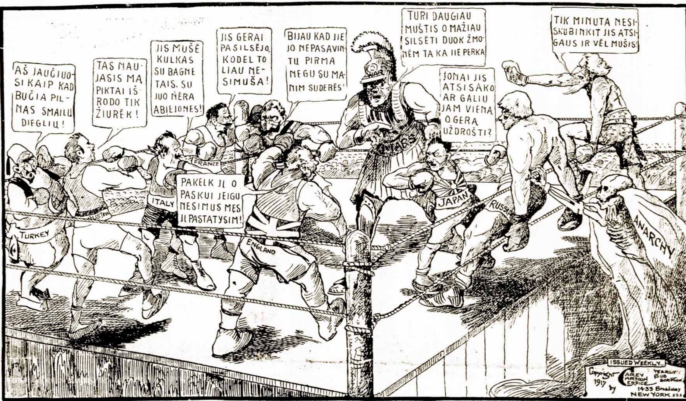
Duokite jam atsigaivinti.

Londonas, birž. 13 — Sakoma, kad šalininkai buvusio graikų premjero Venizelos, kuris atsiskyrė nuo senos graikų valdžios ir įsteigė revoliucionišką valstybę su sostine Salonikyje, tikisi kad dabar jis taps viens iš ministrų vėl suvienytos Graikijos ir veiks iš vien su nauju Graikijos karalium del didžiausios Graikijos naudos. Tikimasi, kad naujas graikų karalius gal išrinkt Venizelos premjeru.