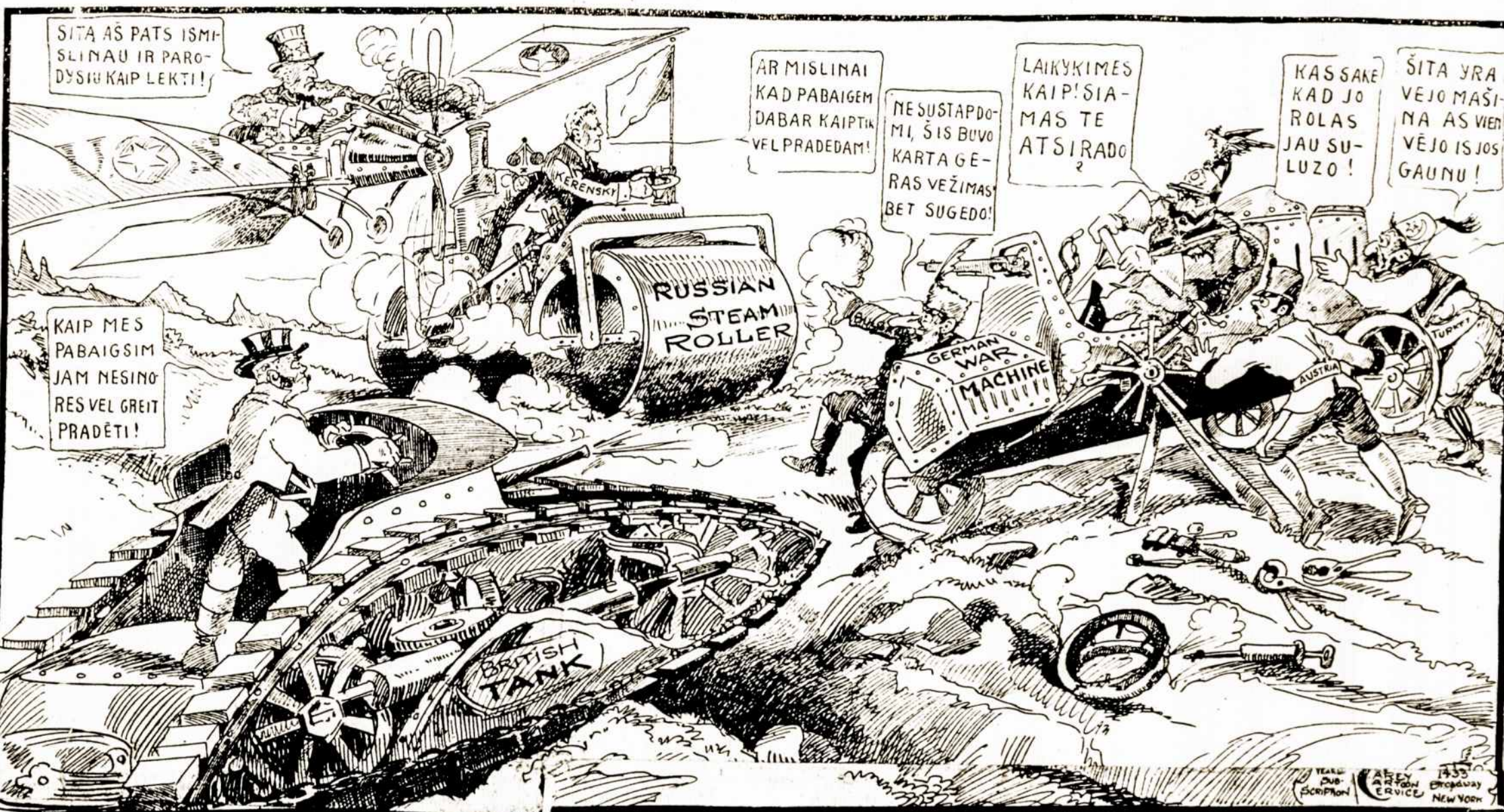
MAŠINOS PRIEŠ MASINAS, VILIAU!

Išilgai Aisne upės fronto, labai smarkus kovojimas tebejo per visą praeitą naktį. Didelės vokiečių spēkos vėl ir vėl atakavo francuzų pozicijas. Francuzai atmušė visas atakas su dideliais nuos-