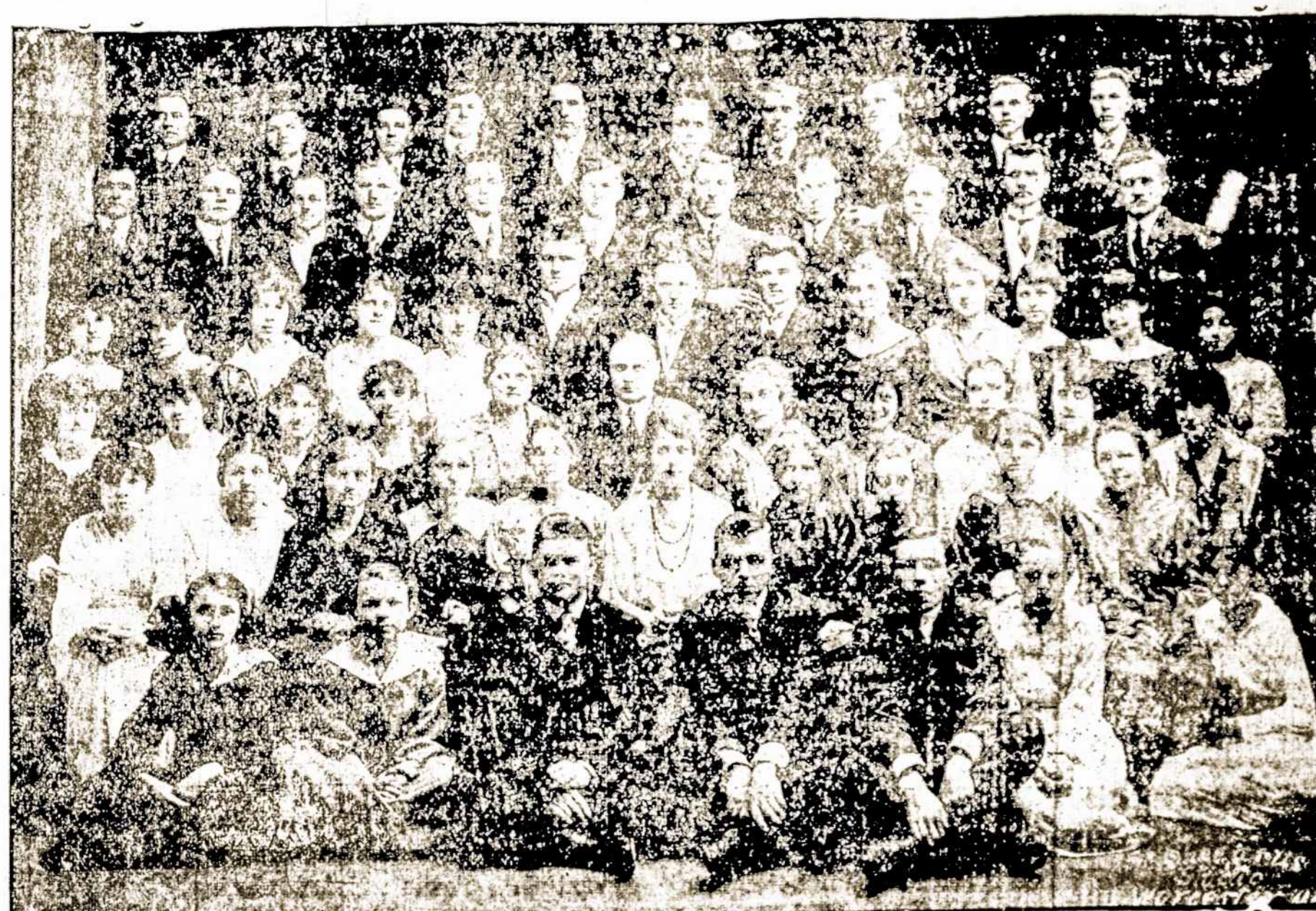
Worcesterio Sv. Kazimiero Bažnytinis choras.

Didžiausias Gegužinis ir koncertas kurių dalis pelno eis karės nukentėjusiems. Rengia Lietuvos Vyčių 26-ta kuopa. Atsibus nedėlioje 2-ą dieną rugs. september, 1917 m. Dalyvaus visos Naujosios Anglijos Apskričio Lietuvos Vyčiai. Gegužinis atsibus šale miesto ulkės, važiuojant gatvekariais City Line, Clinton ir Lincoln st. Gauti galima gatvekarius palei City Hall ir palei Union Station. Pradžią 1 val. po pusdienį. Gegužinio programos susidės iš tyro oro žaislų, šokinėjimų, sukinių ir lenktynių. Atsižymėjusiems žaisluose bus duotos dovanos. Nuo Gegužinio visi ant koncerto. Kurio programą atliks 3 chorai žymūs kalbėtojai ir Solistai visos Naujosios Anglijos. Atsibus svetainėje A. O. H. Trumbul gatvės. Pradžią 7tą val. vakare. Įžanga 35 ir 25 c., vaikams 10 c. Taigi visi neapleiskite progos.