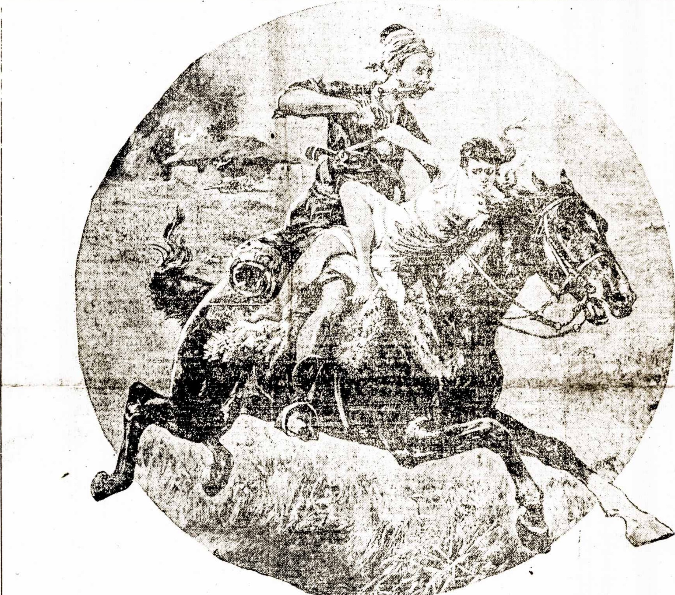
Kazokų užpuolimas ant nuošalaus rusų kaimo. Gana tankus atsitikimas laike carų viešpatavimo.

Londonas, rugp. 24 — Gar sus kalnas 304, paskutinė svarbi tvirtovė kurią vokiečiai laike Verduno apilinkė-