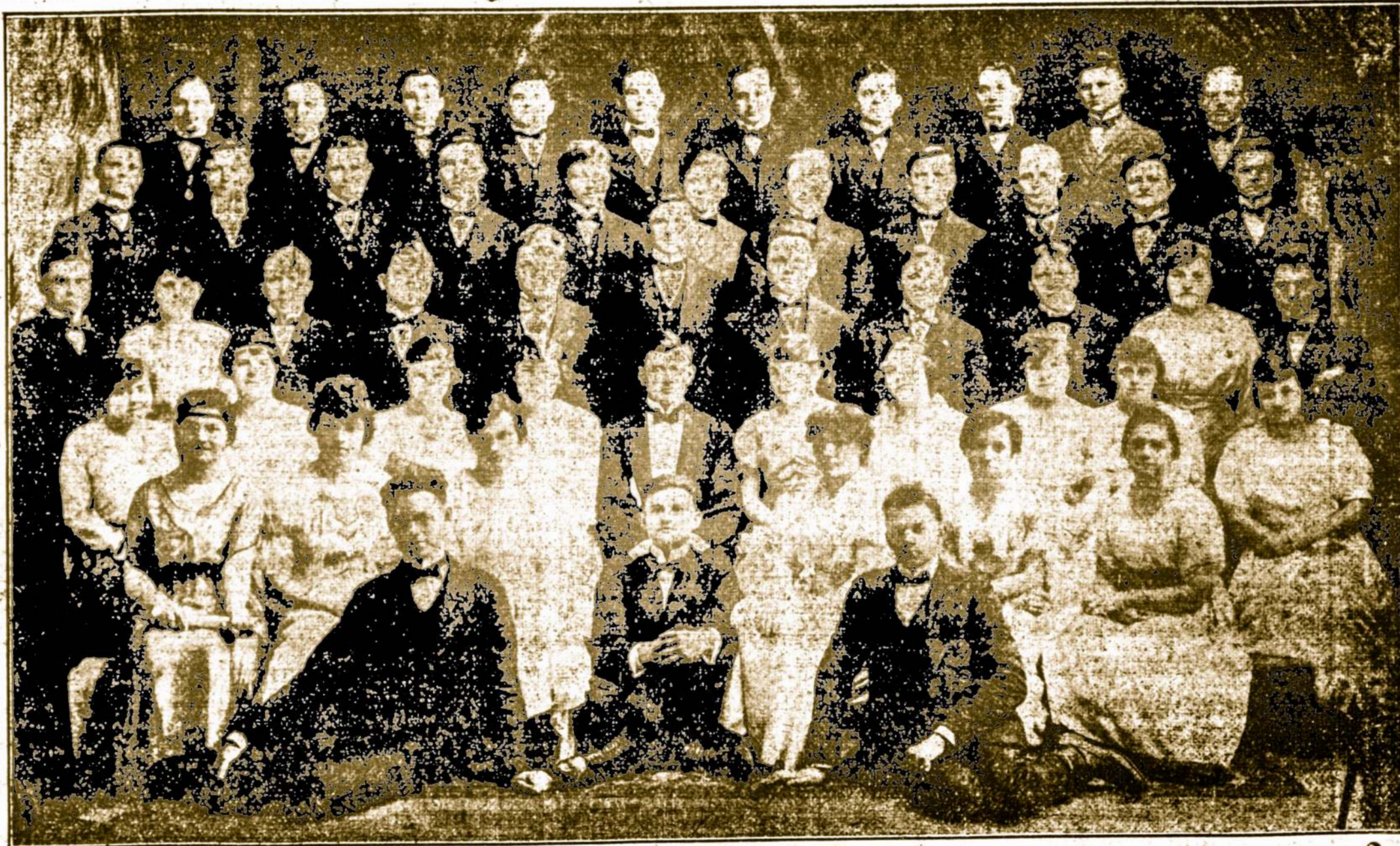
L. S. S. 40 kuopos Choras