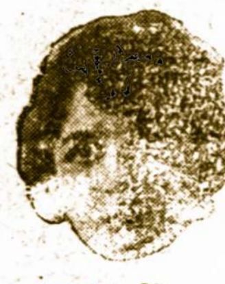
Hedda Nova W No. 4