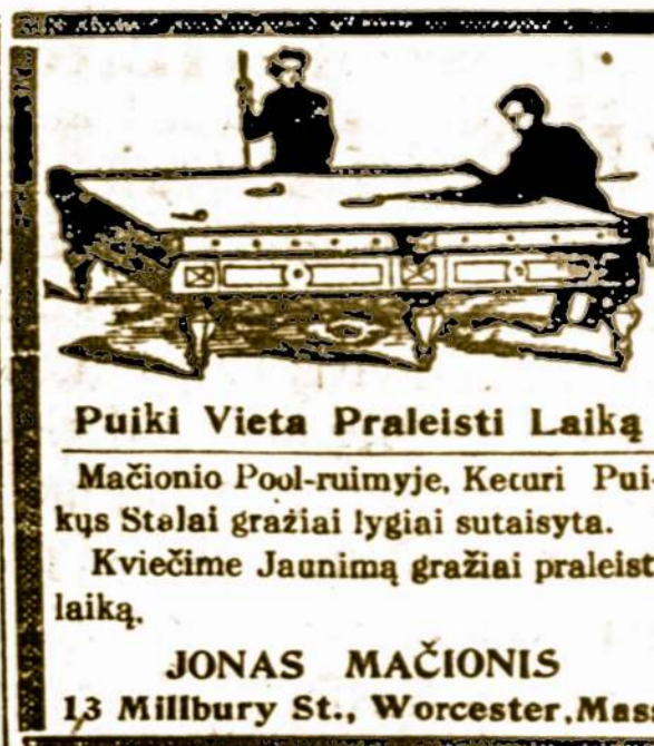
Puiki Vieta Praleisti Laiką

Mačionio Pool-ruijyje, Keturi Puikių Stalai gražiai lygiai sutaisyta. Kviečime Jaunimą gražiai praleisti laiką.