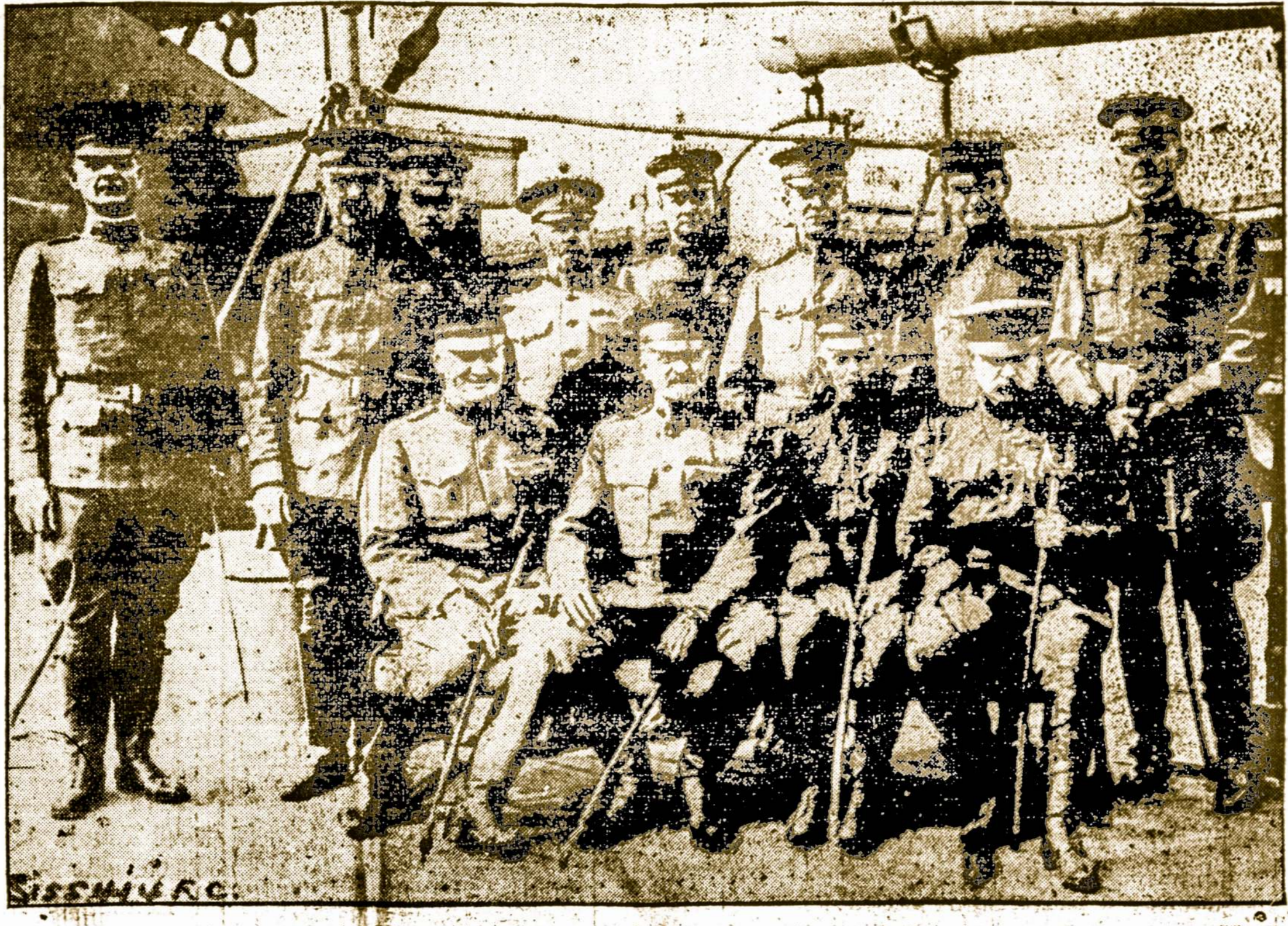
Amerikos štabas, kuris gera į veikia Francijoje.

Londonas, rugp. 8 d. — Gauta žinios, kad social-revoliucionieriai yra nutarę terorizuoti vokiečius Rusijoje. Jie įvykdino eksploziją Kijeve, kurioj 700 vokiečių žuvo. Roma. Gauta žinios, kad karės stovis tapo apskelbtas Ukrainoje, po Eichorno užmušimo, iš priežasties riaušių, kurios tnomet kilo. 500 ypatų tapo suareštuoti už Eichorno užmušimą, tame skaičiuje ir Milukov.