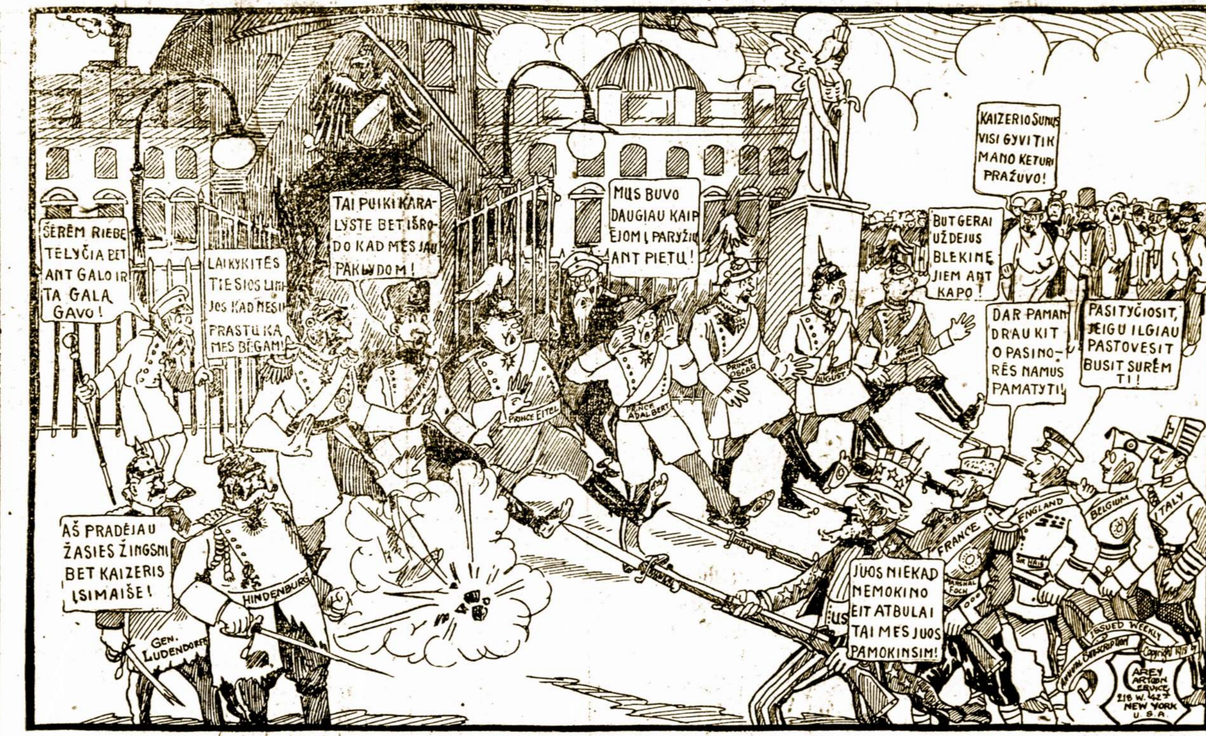
“Zasies žingsniu” atgal.

Washington, rugp. 29 — P. Tčaikovskis, prezidentas šiaurės Rusijos valdžios pranešė, kad jo valdžia nori