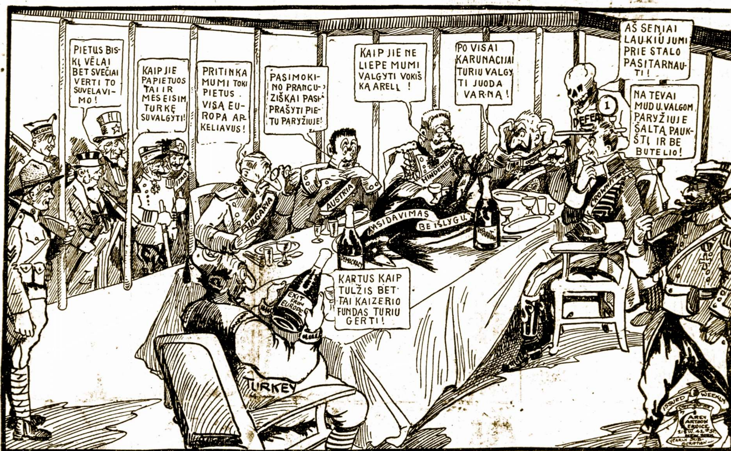
Jie patįs Paryžiuje.

Lapkričio 3 d. serbai atsiėmė savo sostinę Belgradą;