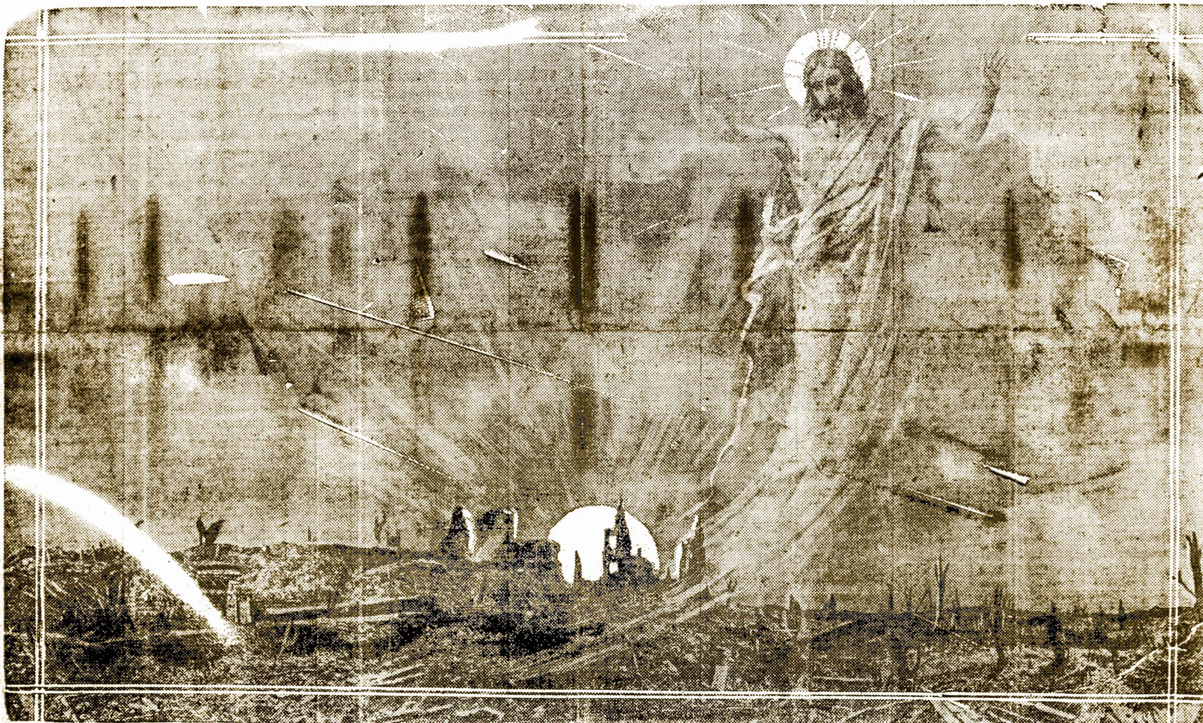
"TAIKA ANT ŽEMĖS ŽMONĖMS GEROS VALIOS."