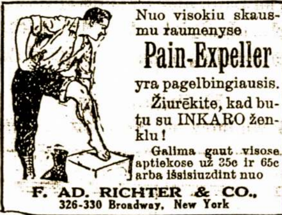
F. AD. RICHTER & CO., 326-330 Broadway, New York.