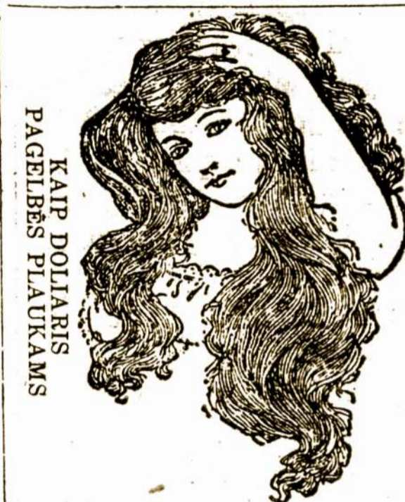
KAIP DOLARIS PAGRIBS PLAUKAMS