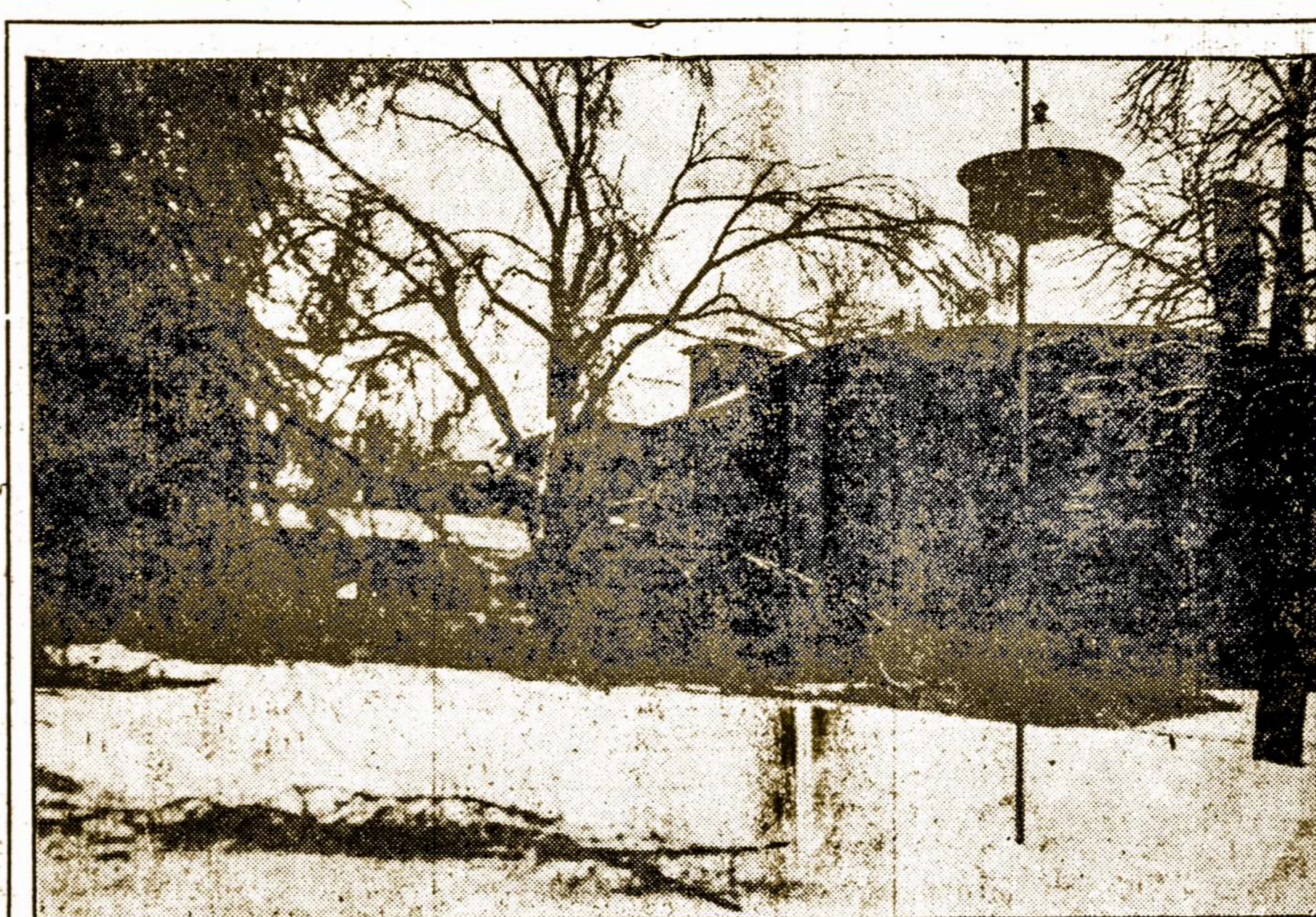
Belmont ligonbutis Worcesterj, po pėreitos savaitės-katastrofai.

Washington, D. C. Konferencijoj kilo sumanymas, kuriuomi pasiulyta konferencijon pakviest ir Vokietija, kuri Suvienytoms Valstijoms skaitosi netolima kaimyne. Situom pasiulymu labai užsigafo francuzai ir todėl Francuzijos ex-priemeris Rene Viviani pagrūmojo, kad jeigu konferencijoj dar kartą bus paminėta Vokietijos pakvietimas, tai