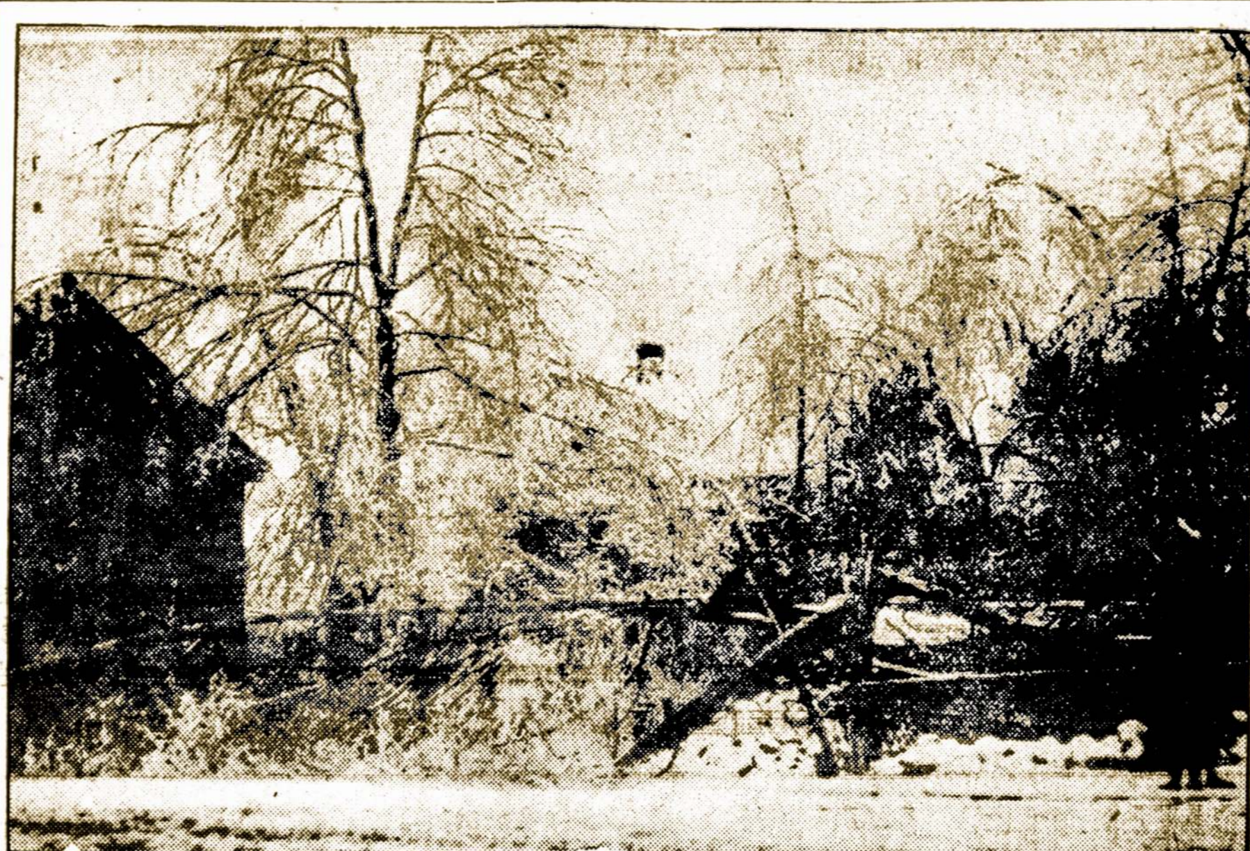
Reginys prie Elm gatvės, Worcesterstyre, po pereitos savaitės katastrofai.

Vilkaviškis. Miesto Taryba posėdyje nutarė teikt pagalbos neturintių tėvų vaikams, negalintiems mokslą eit ir ji einantiems, pradžios mokykloj ir gimnazijoj. Tam tikslui Taryba asignavo 15,700 auks. Dalyko ištyrimui ir vykdymui išrinkta komisija iš 7 žmonių. Taip pat nutarta įkurt vakarinius kursus analfabetams, neski-riant amžiaus, tautos, tikybos ir lyties. Dalyko vykdymui išrinkta komisija. Mokytojams bus moka-