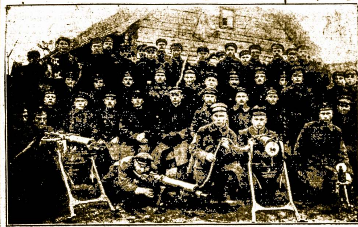
Lietuvos kariūnenės kulkasvaidžių 2 kuopa.

Roma, Italijoje. Popiežius Pijus prisakė kardinolui Gaspari apžiūrėt vaitikano rumą ir pašalint iš jo visus senus baldus, jų vieton superkant naujus. Kadangi visos rumo išpuošimui ir visus senus baldus pakeičiant naujais reikia labai daug pinigų, tai tas viskas bus daroma