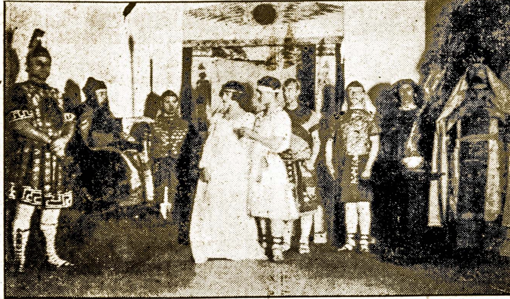
SCENA IŠ PASKUTINIO VEIKSMO.