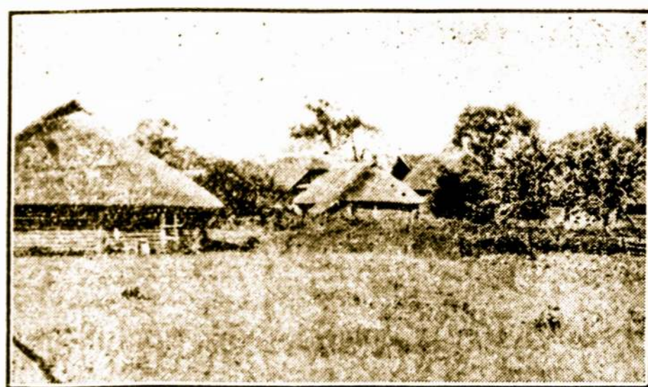
Vaizgirdonys, Alytaus apskrįcio.