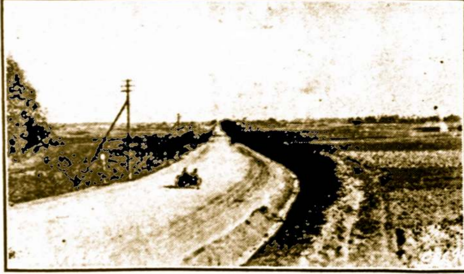
Plentas nuo Mariampolės krašto į Vilkaviškį.