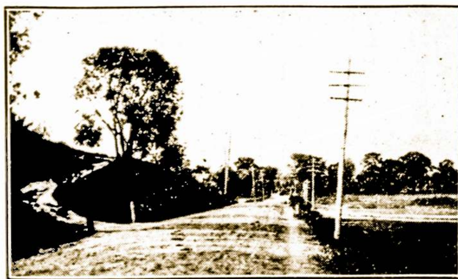
Plentas į Kedainius.