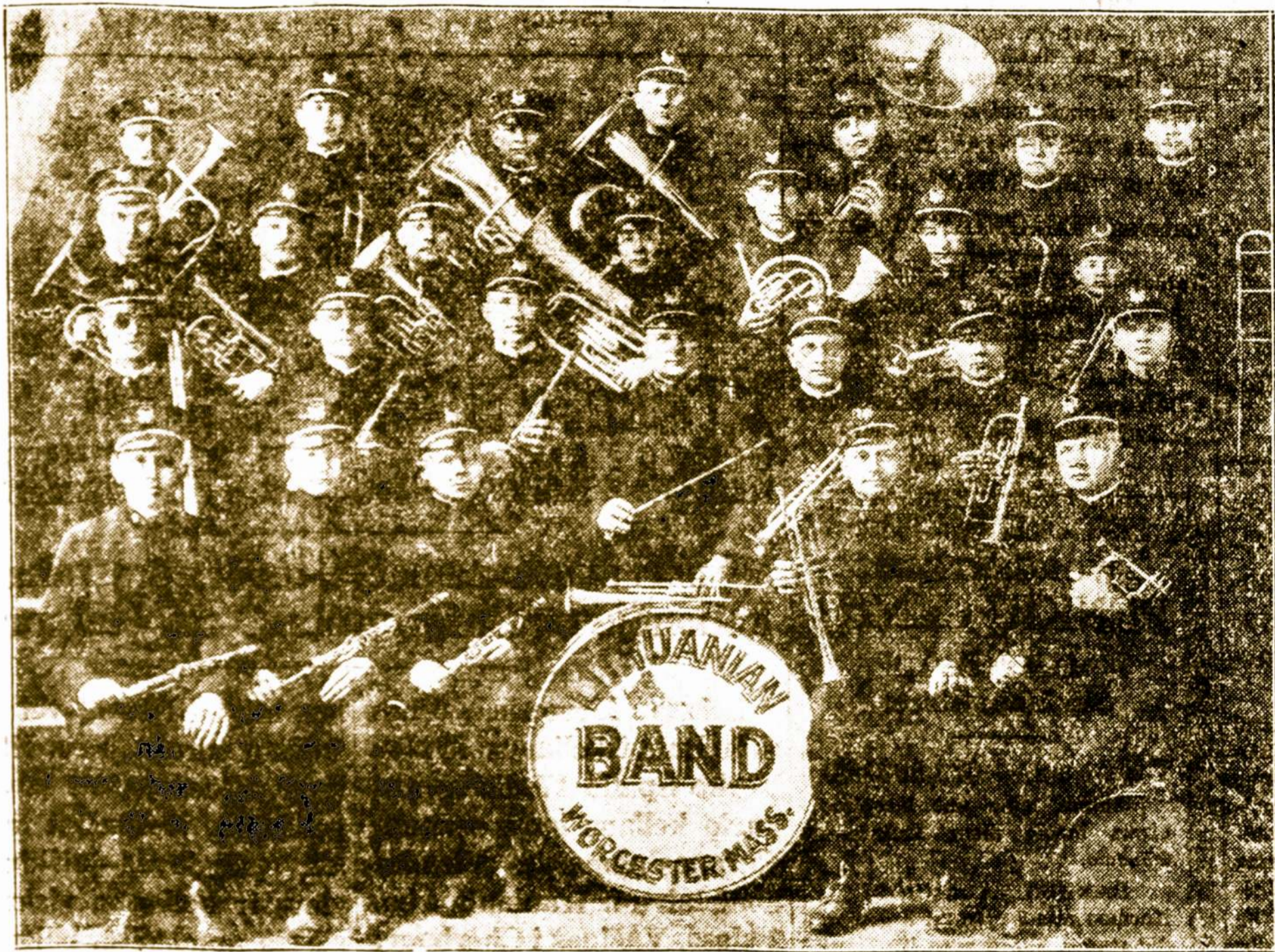
WORCESTERIO LIETUVIŲ BENAS

"AMERIKOS LIETUVIS," 14 VERNON STREET, WORCESTER, MASS.