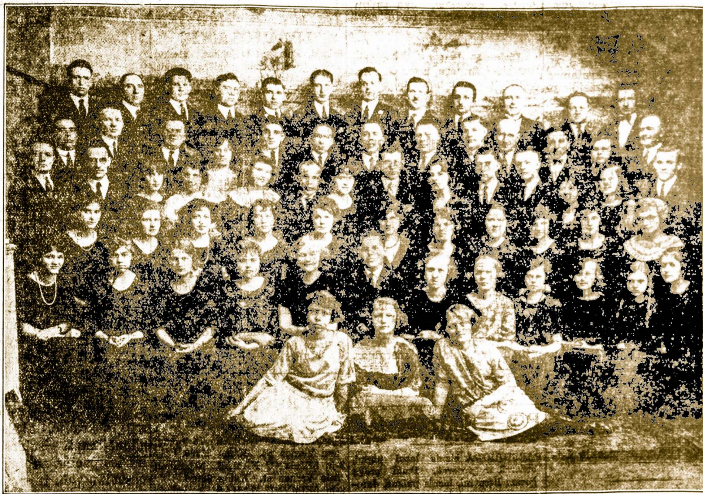
AUŠRELĖS CHORAS IŠ WORCESTERIO

prasadės tuo- jaus po pietų, Hartford'o LIETUVIŲ PARKE Glastonbury, Conn.