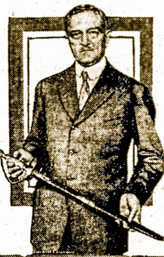
Venezuelos prezidentas suteikė gen. J. J. Pershingui kardą, prieš jo išplaukimą į Pietinę Ameriką, kur ves Tacna—Arica plebiscitą.