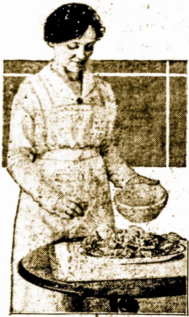
Daržovių salatas, gatavai sukombinuotas. Paskutinis žingsnis, užpylimas dressingo.