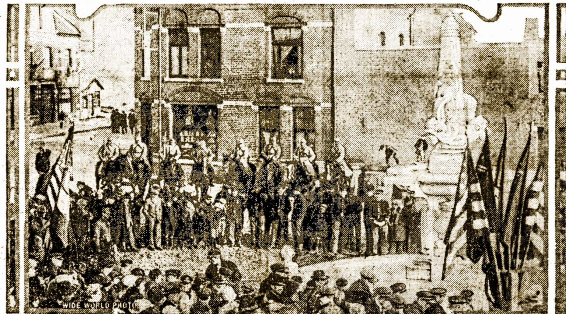
Ambasadorius Herrick atidengė fontaną La Basse, Francijoje, atminčiai jo pirmtakuro Robert Bacon. Premieras Briand ir M. Jules Jusserand dalyvavo ceremonijoje.

Tačiau negalima dvejojti, kad kaip rytų Europos sut-