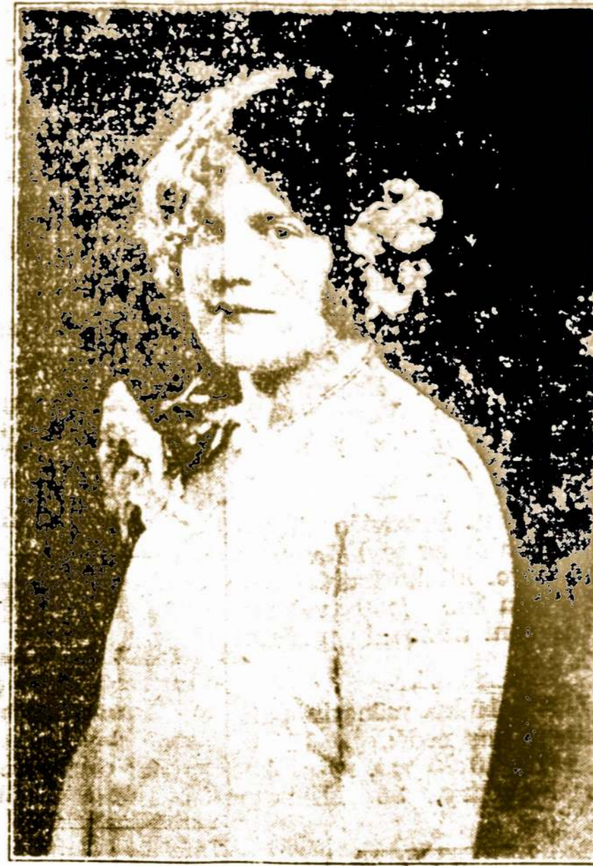
JULĖ MITRIKAITĖ, soprano