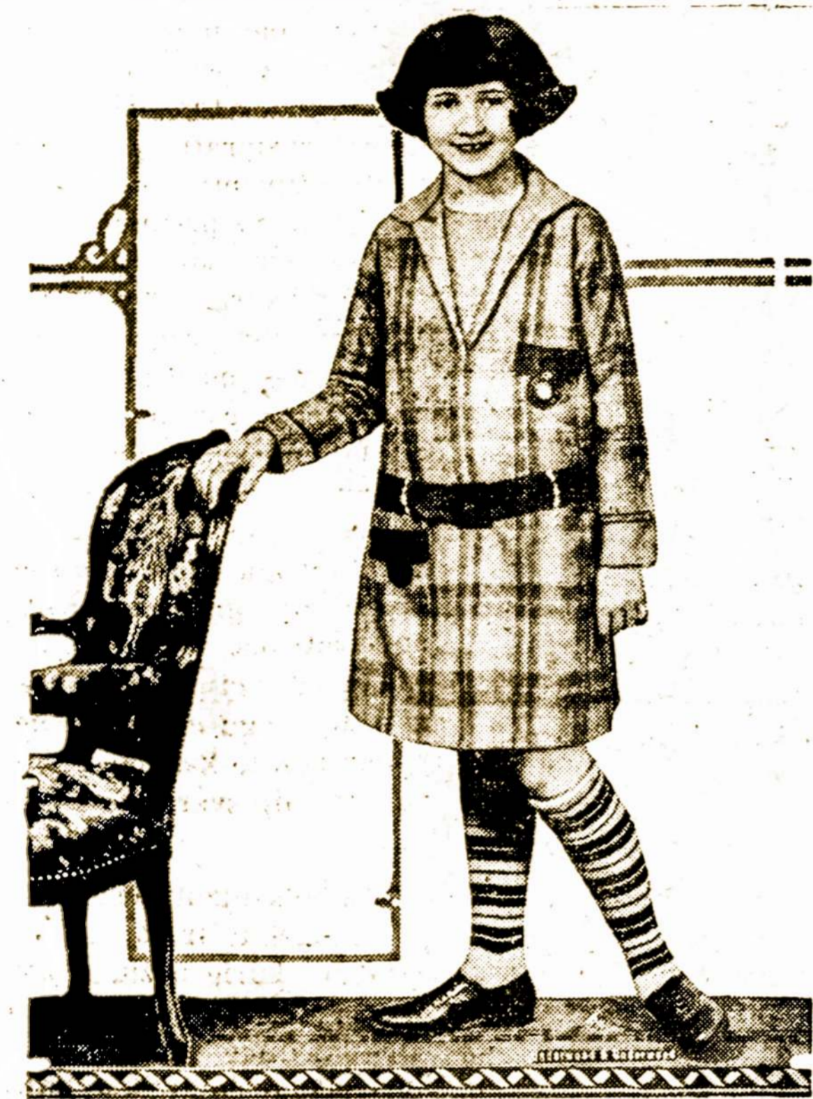
Mados mažom mergaitėm—pavasariui bus nešiojamos daug spalvės suknelės, vilnonio ir šilkinio audklo. Spalvuotas odinis diržiukas būtinais reikalingas prisi laikymui mados. Tokios pat spalvos, audklas vartojamas apyvedžiojimui kišenių ir kalniერიuku. Suknelės lengvos pasiūt, ir labai praktiškos kas-dieniniam nešiojimui.