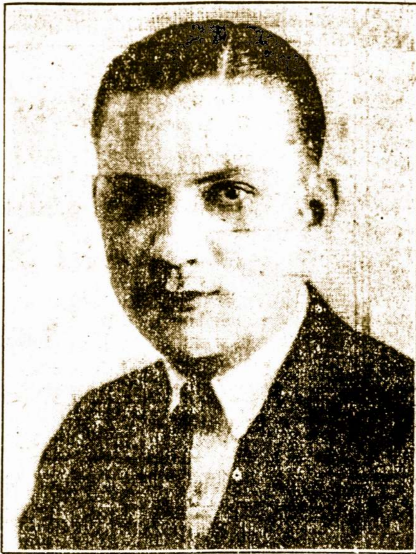
PRANAS STANTON, baritonas