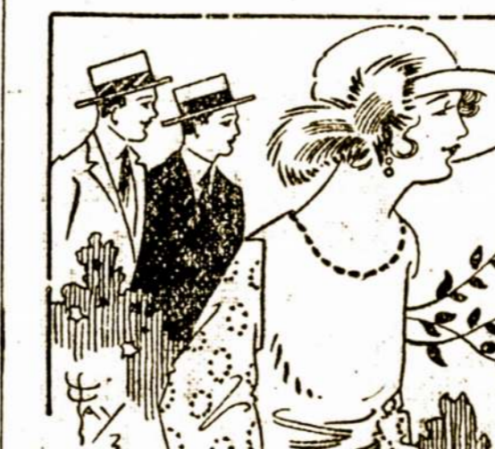
Prie jos limpa