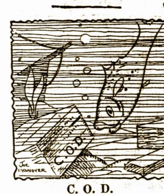
C. O. D.