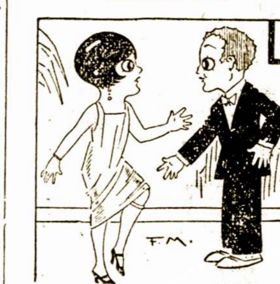
Ne taip bučiuoji