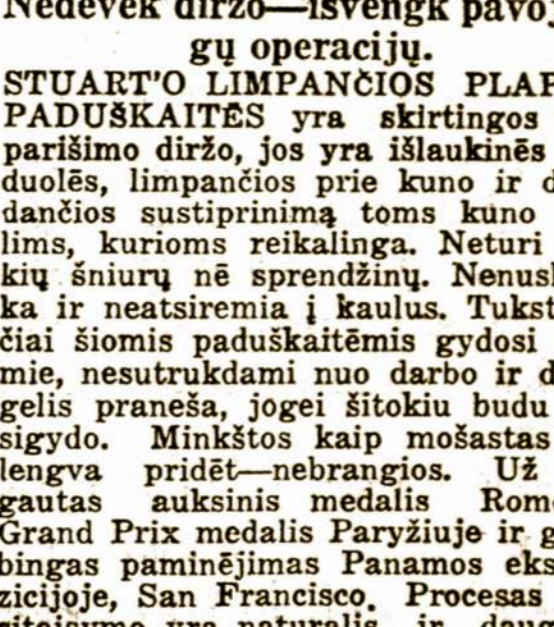
DYKAI NUO PATRUKIMO