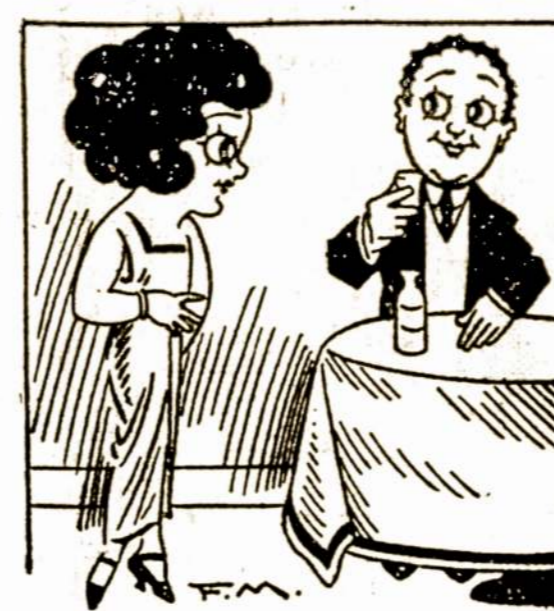
Kam geri, kad sveikas?