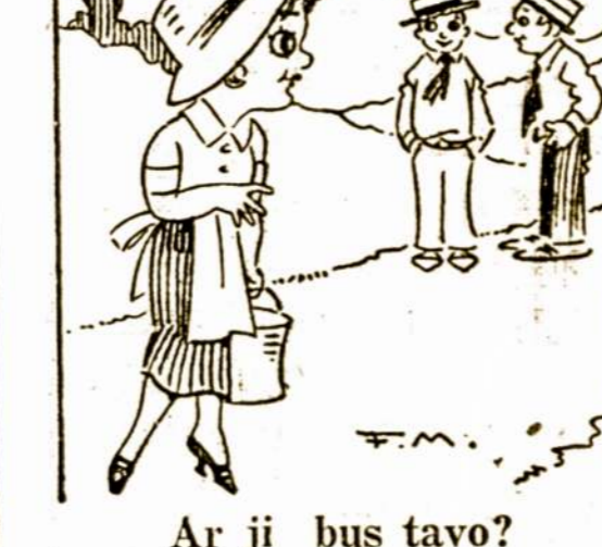
Ar ji bus tavo?