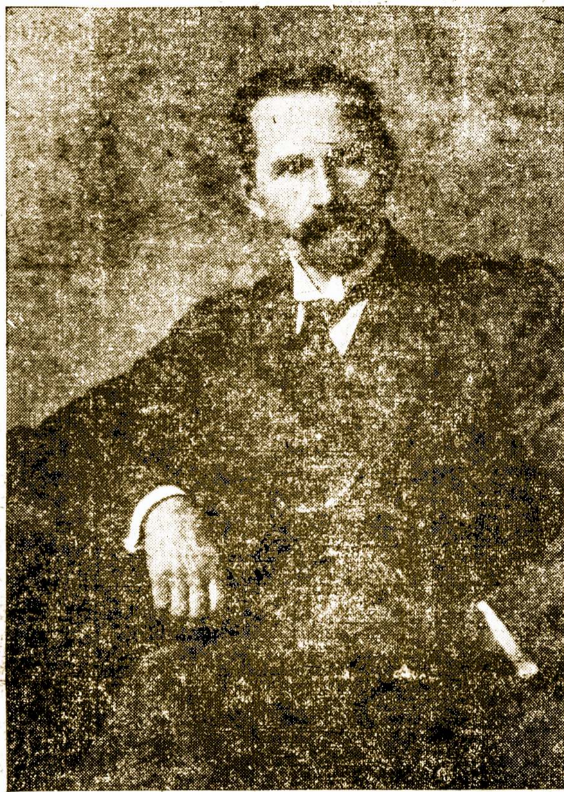
Pirmas Lietuvos Prezidentas A. Smetona; dabar jau diktatorius

Tarp Sąjungų Centro Biuro ir Vienybės Komiteto eina nuolatinė kova. Centro Biuras matydamas bolševikų pasiryžimą užgrobti profesines sąjungas, išleido šio kio turinio atsisaukimą: "Lietuvos darbininkams.— Norėdami užgriebti profesines sąjungas, grupę asmenų, pasivadusių "tikraisiais darbininkais," emėsi skaldymo darbo. Matydami, kad sunkiomis kovomis atstatytas darbininkų sąjungų centras — Centro Biuras nepasiduos jų komunistinei diktaturai, pradėjo tą darbininkų Centrą įvairiais budais griaut. Nuo bendro darbininkų judėjimo atskėlė kelias profesines sąjungas, jie sudarė kitą Centro Biurą, bet, bijodami to