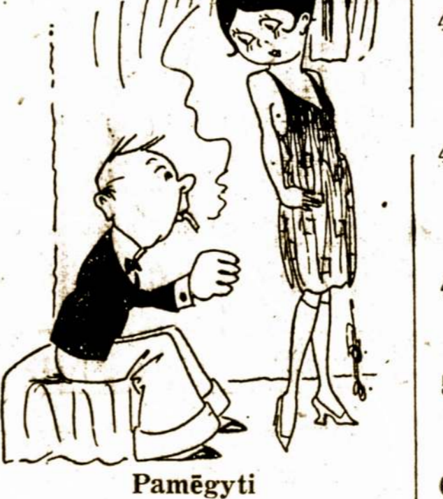
Vyras—Ar tu girdėjai tą idėją išmėgty ženybinį gyvenimą?

—Taip! Jis taip greit apsidirbo, kad aš neturėjau laiko nė to gerumo išpažint.