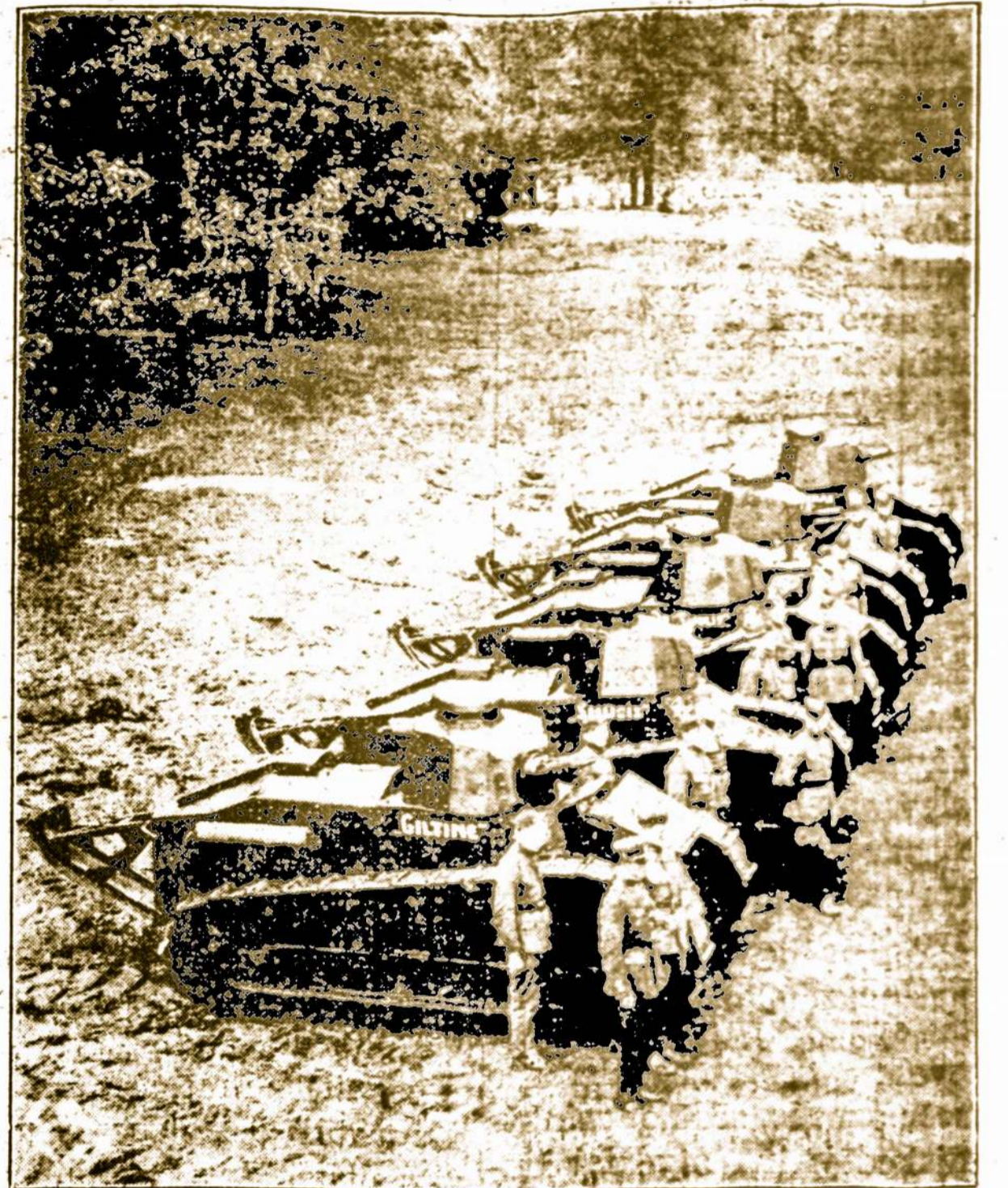
Lietuvos kariuomenės Tankų Burys