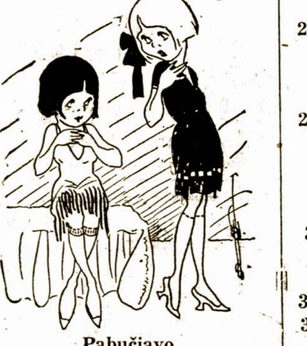
—Tu sakai, kad tas gyvulus, tave netikėtai pabučiavo.

Vyras—Aš tau sakau, aš nevesiu pačios pakol merginos neuzsiėgies ir nenešios dorų drabužių.