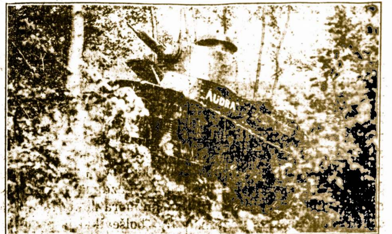
Lietuvos kariuomenės Tankos "Audra", šliaužimas per tankumynus.

Nuo 1924 m. veikia "Kariuomenės sporto" draugija. Be to, karo apygardų štabuose ir dalyse eina karininkų mokymas.