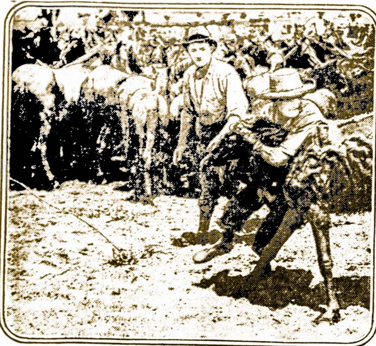
Periodinis gaudymas laukinių arklių

Daugelis pietinių valstijų atjaucia sunkenybę nepaprastai didelio vatos derliaus ir visai žemų jo kainų. Vienok, North Carolina, kuri netik augina, bet ir išdirbą vata, neatjaucia sunkenybės. Ji pamažėl tampa nemažu industriališku centru, stato fabrikus ir naudoja ramias upes ir upelius iegos gaminiui. Charlotte, siekiama Gastonia, vienas didžiausių audinių centrų Suvienytose Valstijose. 3/4 šio miesto 20,000 gyventojų dirba 42 fabrikuose. Bet plačiose, ramiose miesto gatvėse negalima jaust koncentruotos industrijos atmosferą. Darbininkai nuomuoja namelius už $3. mėnesiui, vanduo ir elektros šviesa teikiama dovanai. Šiltas klimatas nereikalauja daug kuro, kuris ir taip pigiai atsieina. Geresnio gyvenimo nereikia. Blue Ridge kalnų gyventojai, atsikrąstę į Gastonią, padirba tik tiek, kad susitaupinus gaunantį pinigų apmokėjimui savo skolų, ir vėl grįžta į savo numylėtus kalnus, gyventi tingiai, kol susidariusios skolos ir gyvenimo aplinkybės, juos vėl nepriverčia stvertis darbo.