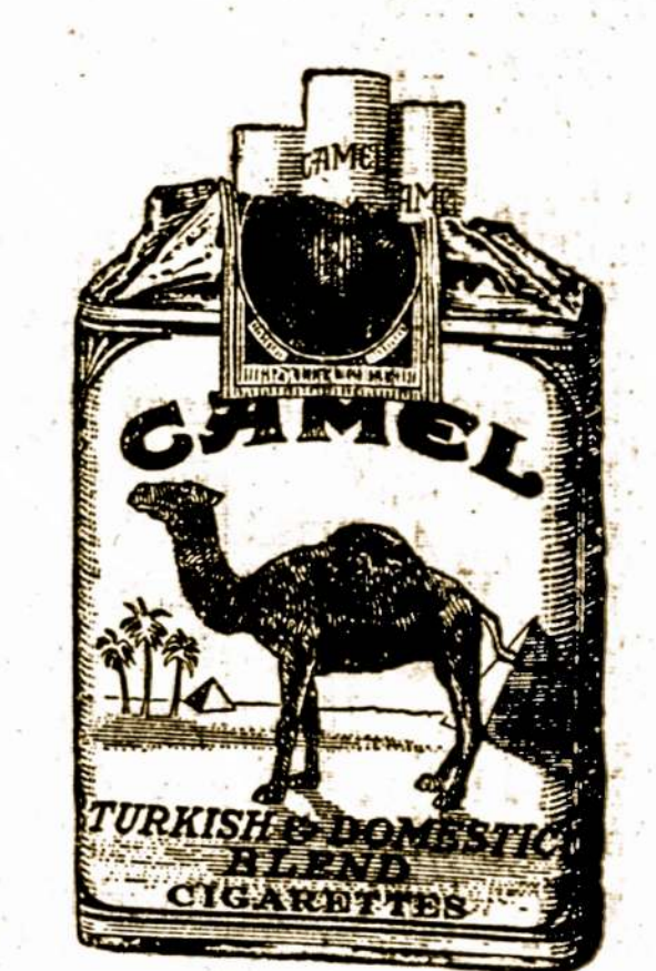
© 1927. R. J. Reynolds Tobacco Company, Winston-Salem, N. C.

Vartokit cigaretes kurie yra užkariavę moderninį pasaulį. Nėra kitų panašių kaip šitie—nežiurint kainos. Visuomet kvėpianti, visuomet lengvas—geriausias rukymas koks kada buvo padarytas. "IMKITE CAMEL."