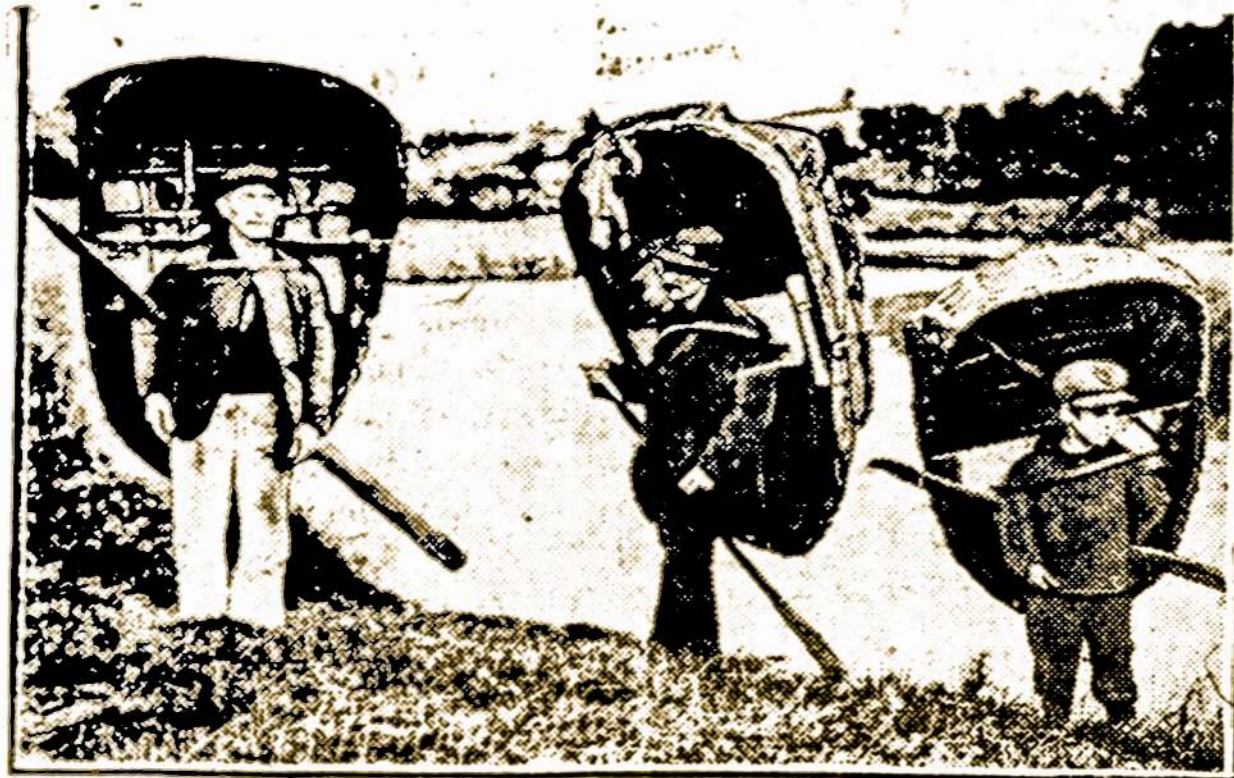
Valijiečiai su savotiškais lėveliais (coracles)

Vaidiškai ir istoriškai, Valija yra viena įdomiausių apelinčių visoj Anglijos teritorijoje, bet visai mažai keleivių teatranko ją. Yra prieinama, viešbučiai nebrangūs ir gerai įrengti, žmonės vaisingi, vieškeliai lygūs, ir vasaros klimatas malonus. Bet paprastas keleivis, pažiūrėjęs į žemlapį, aplenkia ją. Ji atbaido vietų užvardijimai, kaip Bettrosy-Coed, Bodelwyddan, Dwygyfylchi, Clwyd, Clandudno, Pwlheli, ir Pen-y-Gwryd. Įėjęs į gelžkelio stotį, keleivis negali pasakyti kur nori keliauti, ir jei patarnautojas ištaria keletą vietų vardų, kad jam pagelbės, juo sunkiau jam pasisakyti kelionės liniją. Pavzdžiui, rašoma Glyndyfrdwy, tariama Glindivrooi. Vieton laužyt liežuviu ir sukt galvą, kaip tart vietos vardą, keleiviu pasirodo lengvesniu būdu keliauti į kitas Anglijos dalis. Todėl per daug keleivių nesigrūda į Valiją.