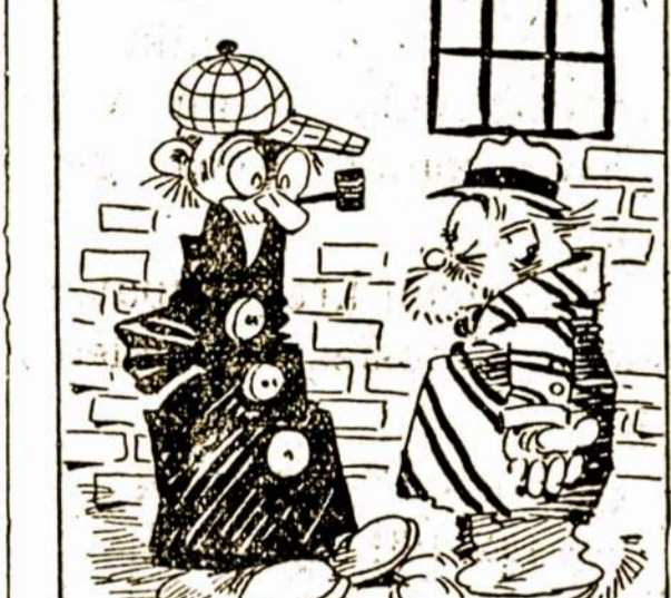
Aš labai nusistebėjau, matydamas tave bevažiuojantį šiandien.

Vyras—Taigi, aš ir mislinau apie tuodu nauju daiktu.