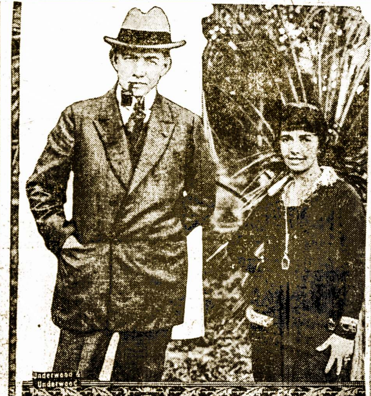
Suvienytų Valstijų vice-prezidentas Dawes su savo seseria aplankė Jacksonville, Florida.

Seimo posėdy balandžio 12 d. p. min. pirmininkas prof.