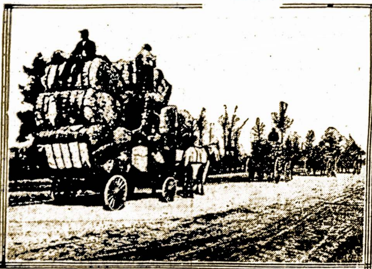
Vatos pundai vežami iš fabriku

Suvenytos Valstijos yra svarbiausia vatos vietovė, nors vatos svarba jaučiama visame pasaulyje. Dieną ir naktį, paprastas žmogus jaučia vatos įtakę. Jis miega ant minkšto matraso, prikimšto puriais vatos pūkais. Jis šluostos vatinius rankšluosčius, apsivelka baltiniais padarytais iš vatos. Celuloido šukos ir šepetėliai, kuriuos jis vartoja, padaryti iš vatos augmenų. Pusryčius taipgi neapsieinama be vatos. Staltiesės padaryta iš vatos. Margarinas, vartojamas vietoj sviesto, išdirbtas iš vatos - sėklų aliejaus. Net ir laikraštis rytmety skaitomas, paeina iš vatos, ir jo kompozicija įeina maža dalis vatos produkto.