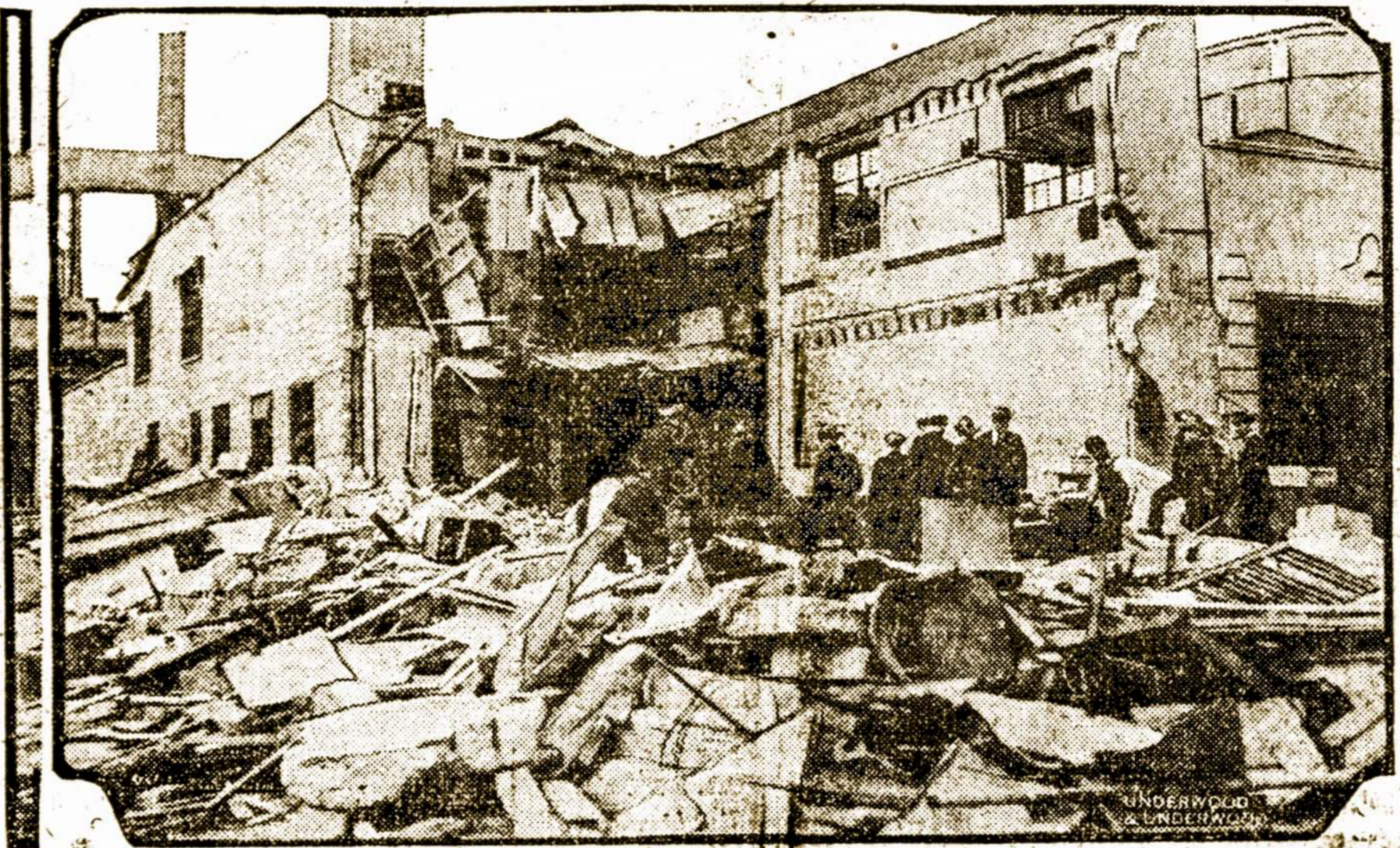
Geltou "taxi" ofisai suksijoduoti New Yorke

Berlinas, Vok., geg. 29. — Anglų Sovietų nutraukimas ryšių, kokie buvo padaryta,