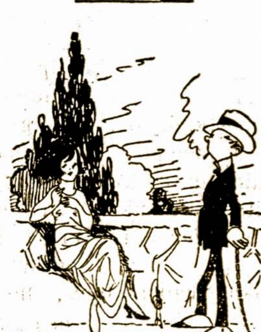
Tik dvi bėdos

—Tu manai, kad jis atras sau namus jos širdyje. —Nežinau, man atrodo, kad jos širdis ne namai, tik taip saų užeinama vieta pakelyje.