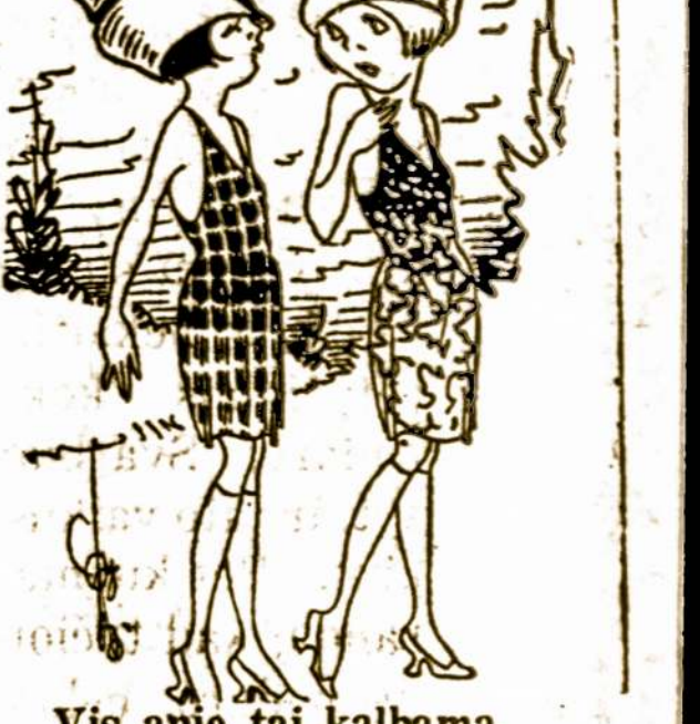
Vis apie tai kalbama

Jis—Tai tu sakai, kad šita ukė tavo tėvo ir jokių bėdų jis neturi? Ji—Taip, jis jokių bėdų neturi, išskyrus motiną ir mane.