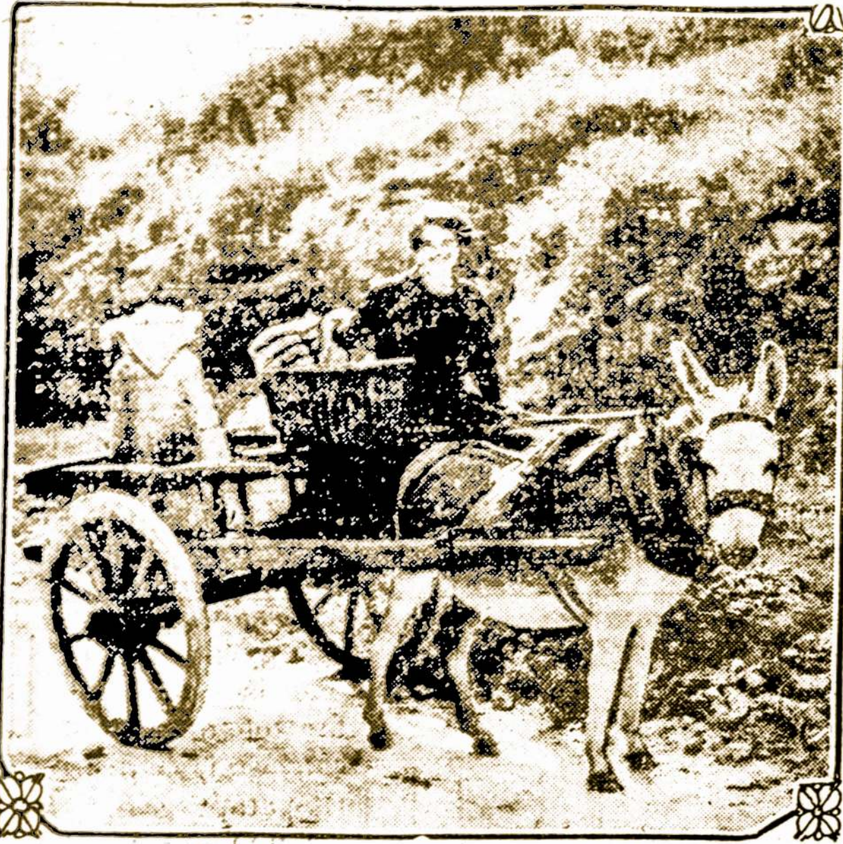
Airioj, ant Tipperary kelio.