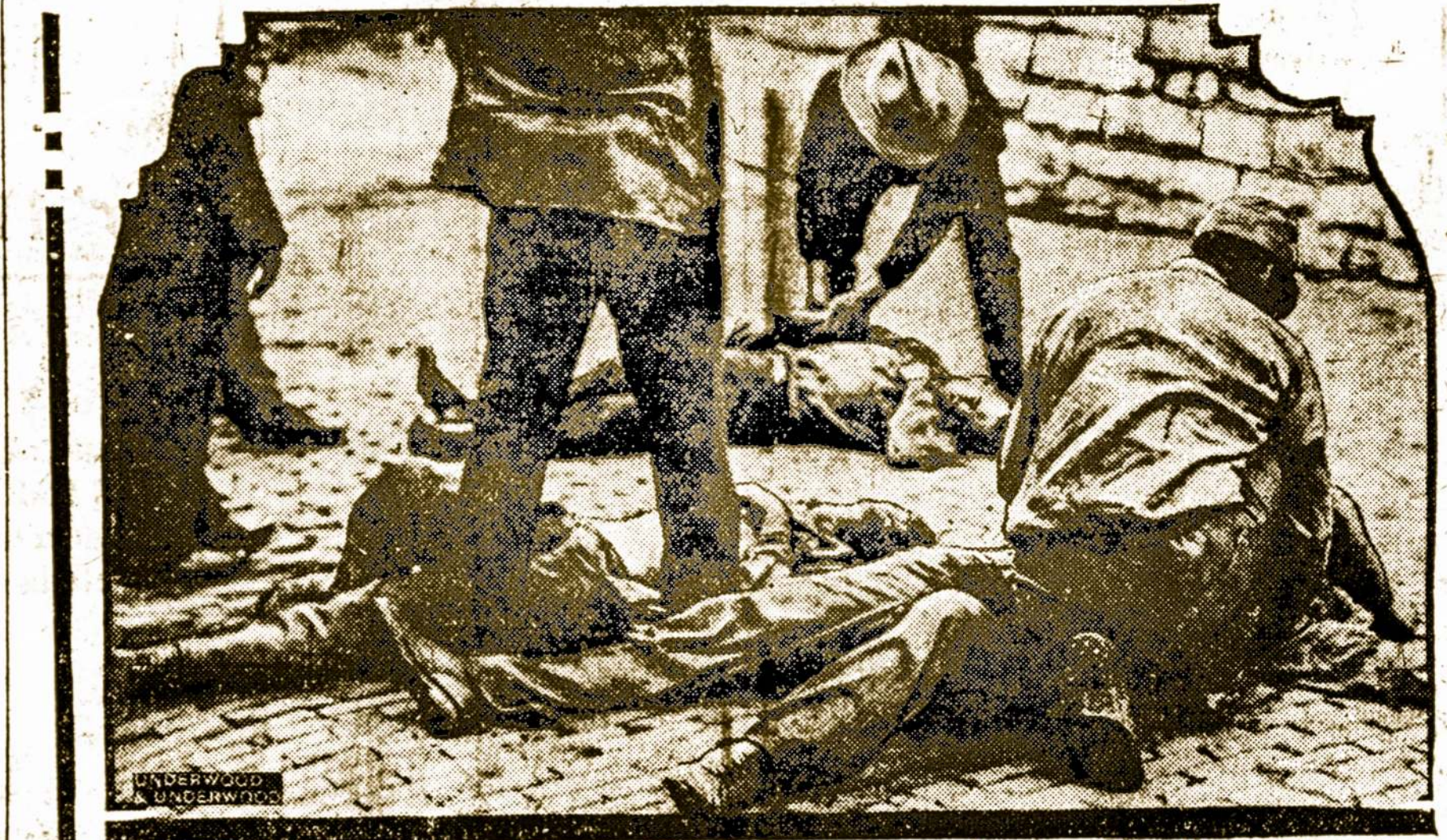
Atgaivina sukilusius kalinius

Dauguma lieka lenkų pusėj (34), mažuma (14) žydu, rusų ir lietuvių pusėj. Bet aišku, kad kairiųjų lenkų atstovai neis petyts petin su endeikais. Kairiųjų atstovų turime 14 (Nr. 2 ir 15), visai neaiškus Nr. 10 (pilsudkininkai) 5 atstovai. Bet jeigu kairieji atstovai (14) panorės eit su nelenkais, tai jau sudarys balsų daugumą—28. Šiaip ar taip dabartinės miesto tarybos sudėtis yra labiau demokratinė, negu pirma. Neturint omenyje