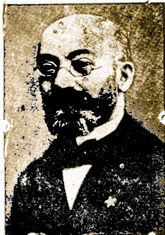
DAKTARAS LIUDVIKAS ZAMENHOFAS, autorius tarptautinės kalbos — Esperanto

(Straipsnis, pašvestas 40 metų Esperanto sukaktuvėms)