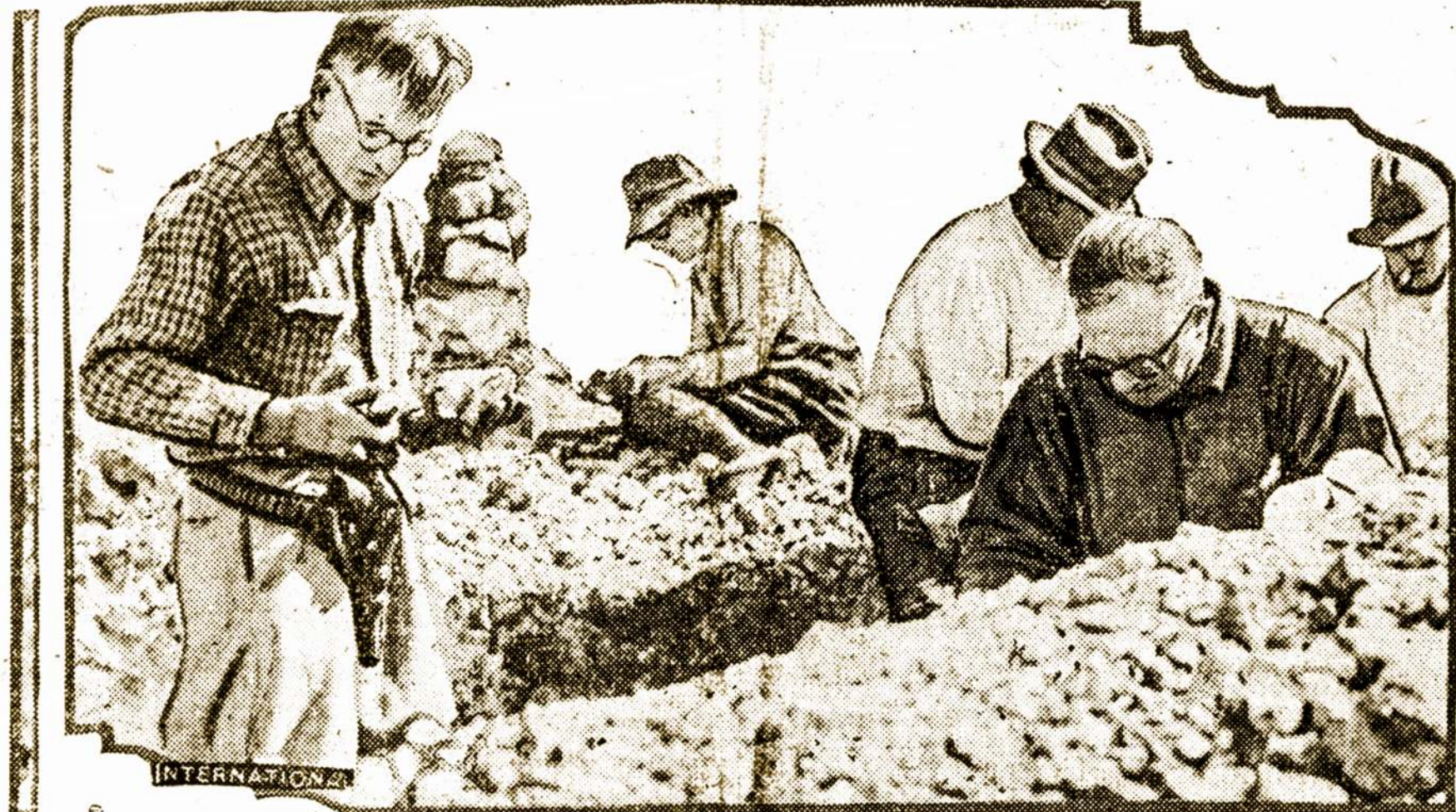
ATRASTA NAUJI AUKSO KLODAI

Sulig pasirašytą sutartimi Lenkija po 20 metų turi grąžinti Amerikos bankininkams 74 milijonus dolerių, tuo tarpu kai gauna už tą sumą tik 58 milijonus, t. y., visas penktadalis paskolos atskaitomas duodančių ją bankininkų naudai. Lenkams bankininkai skiria savo atstovą, kuris kas mėnuo ims po 2000 dolerių algos. Jis turės teisę kištis į visus lenkų piniginius reikalus, tuo pačiu, ir į politiką, nes be jo žinios negalės buti su-