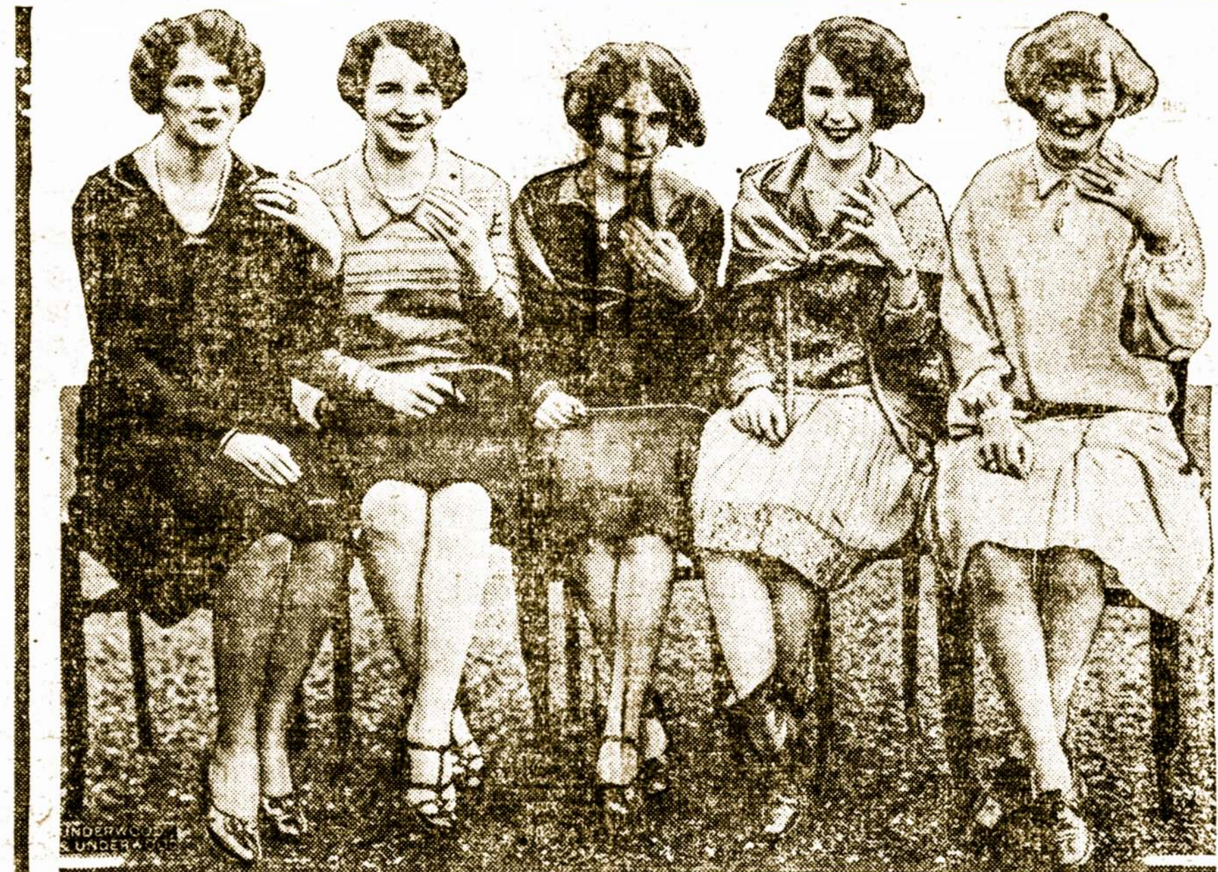
Merginos naudoja "leap year" privilegijomis. Neprašius šių metų vienam mėnesiui, šios penkios panelės, dirbančios vienoj krautuvėj Cincinnati, Ohio, spėjo susižieduot, tik nežinia ar jų pačių iniciatyva, ar jų berniukų.

Negali lenkam patikt ir tai, kad Lietuva nori pradėt derybas nuo Želigovskio smurto pasėkų likvidavimo. Lenkai žino, kad to smurto svarbiausios pasėkos yra dvi: Suvalkų sutarties sulaužymas ir Lietuvos teritorijos okupacija. Be to, dar visoki Lietuvai padarytieji nuostoliai. Tuo tarpu lenkai norėtų viską pradėt tik nuo ambasadorių konferencijos sprendimo. Viską, kas buvo prieš 1923 m. kovo 14 d. lenkai norėtų išbraukt ir apie tai nekaltėt. "Žiurkime pirmyn, o ne atgal." — sako lenkai. Bet Lietuvai tokia tezę nėra priimtina, nors ją ir kažin kaip pirštų lenkai. Nepatinka lenkam ir tai, kad Lietuvos atsakymas kalbė apie Tautų Sąjungos derybose dalyvavimą. Mat, lenkam liudininkai labai nepageidaujami. Jie norėtų tartis su mumis "broliškai", be liudininkų. Be liudininkų tariantis mažiau teira reikalo varžytis, galima sutarto žodžio ir nesilaikyt. Mat, Suvalkų sutarties sulaužymas pamokė lenkus, kad sutarčių laužymas vis tik nemalonus dalykas ir reikia elgtis atsargiau, o ypač reikia vengt liudininkų. Be liudininkų daug kas galima padaryt neturint už tai jokios atsakomybės. O prie liudininkų jau kitas dalykas. Taigi Lietuvos atsakymas lenkam visais atžvilgiais nepatiko. Įdomu, ką gi toliau jie darys. Ar darys naujus pasiūlymus, ar polemizuos su Lietuvos iškeltais klausimais? Ypač klausimo dėl "Lietu-