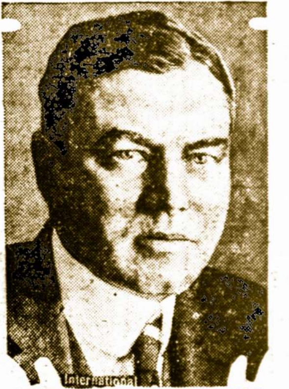
IEŠKO ANTRŲS VIETOS Hamilton Fish, Jr., atstovas iš New Yorko valstybės, laikė kandidatūrą į vice prezidentus republikonų partijos rinkimuose.

Princeton, N. J. — Paul Claudel Francijos ambasadorius Suv. Valstijose tapo Princeton universiteto apdovanotas garbės laipsniu Daktaro literatūros. Apart jo septynios ypatos gavo