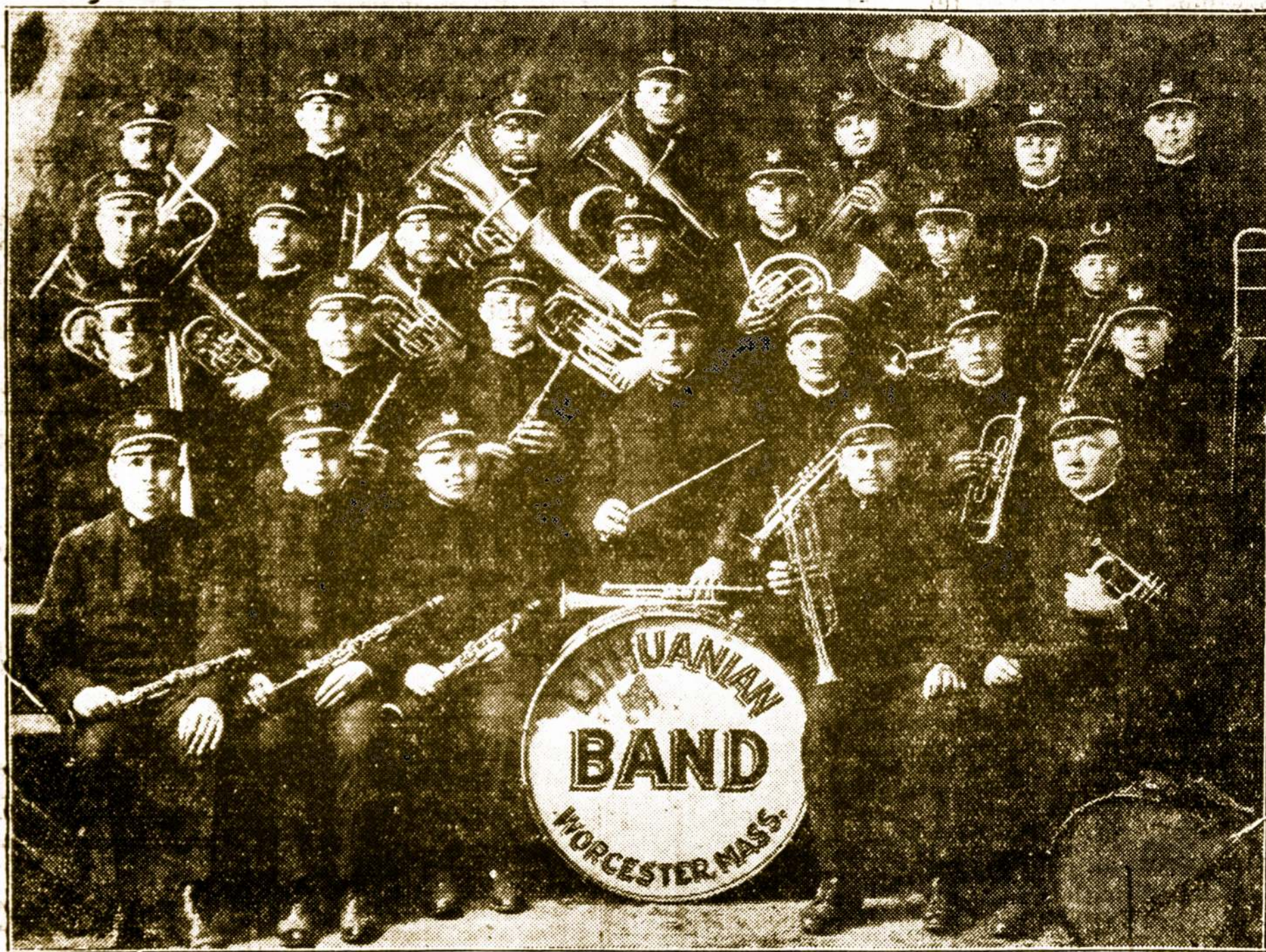
Paveikslas Worcesterio Lietuvių Beno.

GERBIAMI BROLIAI ir SESERIS: — širdin- gai kviečiame visus at- silankyti į "Amerikos Lietuvio" pikniką, rug- piučio (August) 26-tą d. Piknikas prasidės 12-tą valandą ir tęsis iki 9- tos valandos vakaro.