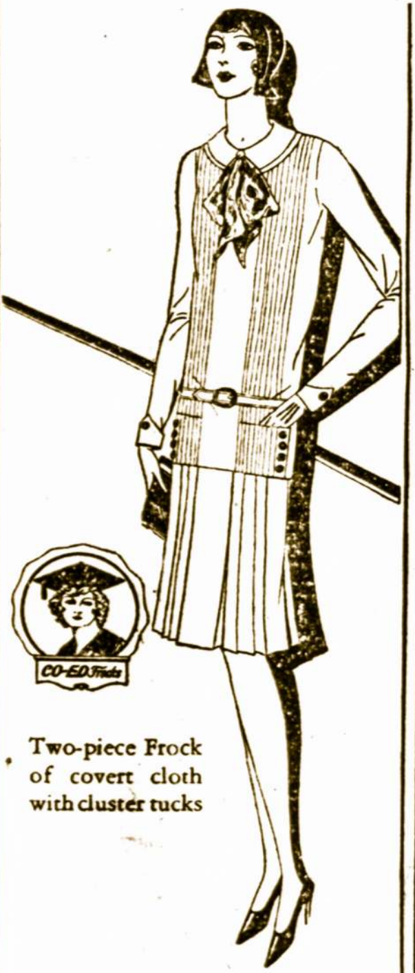
Two-piece Frock of covert cloth with cluster rucks