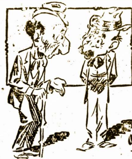
Viešbuty—Na, kaip, tamsta, ar gerai miegojai?

Amerikos Lietuvis 14 Vernon St. Worcester, Mass.