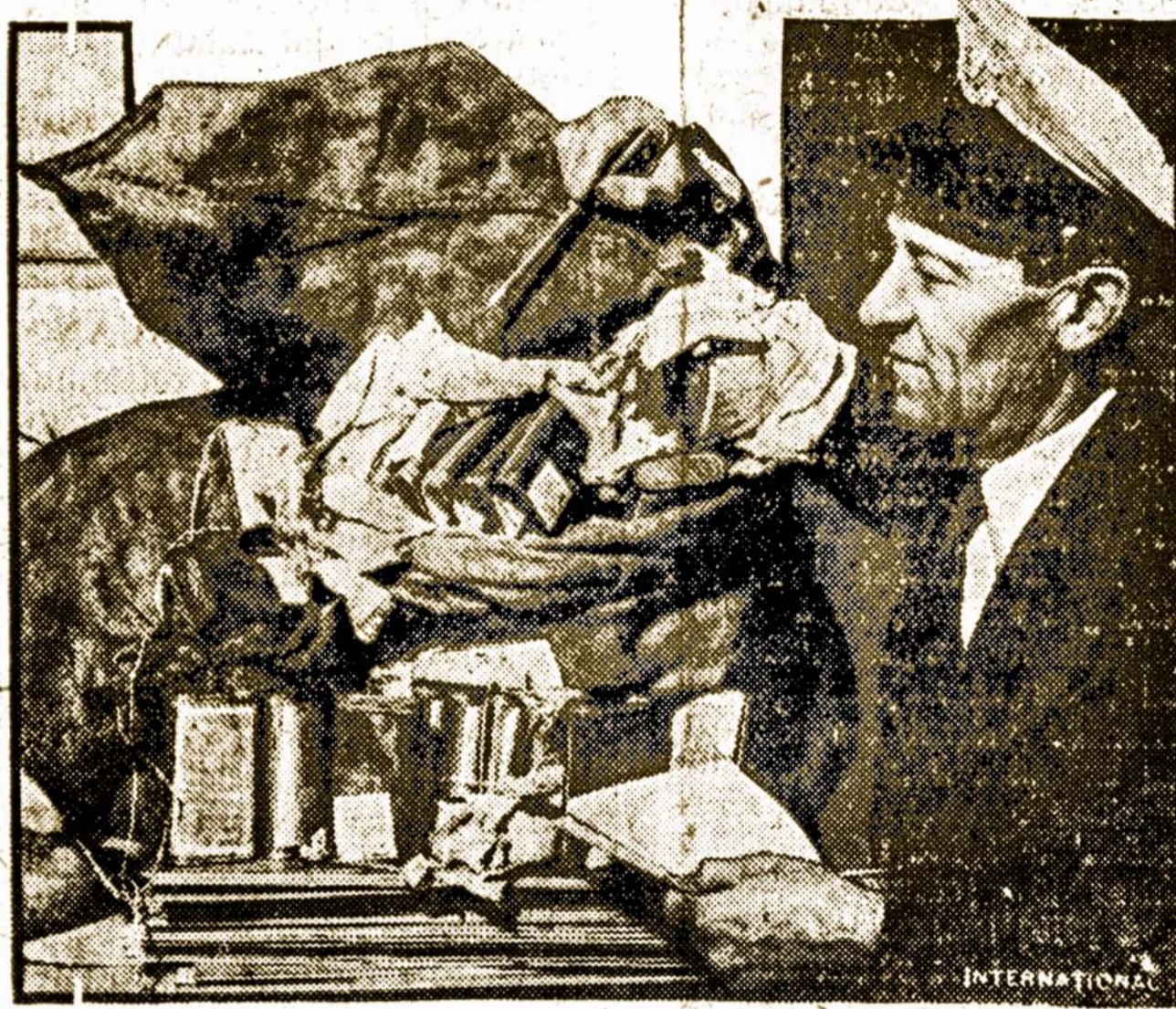
Suv. Valstijų muitų viršininkai konfiskavo opiumo vertės $34,500, laike kratos ant Dollar Linijos laivo President Jefferson, kada pasiekė San Francisco. Opiumas, sudėtas į 300 blėtų, buvo rastas po iškrėtimui viso laivo.